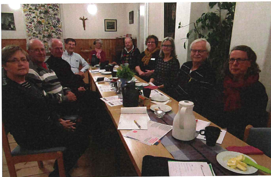
Kretsträff i Djura med representanter för hembygdsföreningarna i Åhl, Siljansnäs och Djura.