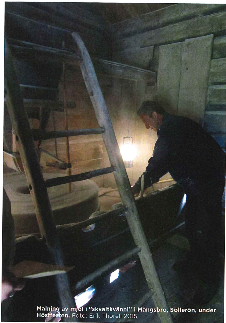
Malning av mjöl i "skvaltkvänni" i Mångsbro, Sollerön, under Höstfesten. Foto: Erik Thorell 2015