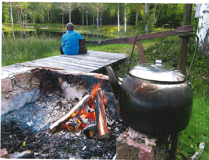
Kaffepaus vid skvaltvarnsdammen i Mångsbro, Sollerön.

Dalafilmprojektet som initierats av DFHF är nu i sin helhet överfört till Dalarnas museum.