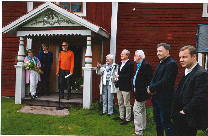
Mottagarna av Dalarnas Byggnadsvårdspris och jurymedlemmar samlade utanför Sammilsgården, i Gulleråsen, Boda.

Det har hållits fjorton kretsträffar till vilka alla föreningar inbjudits kommunvis. De samlade tillsammans 165 enskilda medlemmar och funktionärer från föreningarna. Vid träffarna medverkade också representanter för Studieförbundet Vuxenskola med information om det nya samarbetsavtalet. Kretsträffarna hölls i Sätters kommun, 9 september i Gustafs, Älvdalens kommun 15 september i Idre, Malung-Sälens kommun, 16 september i Malung, Vansbro kommun, 17 september i Vansbro, Smedjebackens kommun, 22 september i Söderbärke, Rättviks kommun, 23 september i Boda, Ludvika kommun, 30 september i Strömsdal, Mora och Orsa kommuner, 7 oktober i Vämhus, Leksands kommun, 14 oktober i Djura, Gagnefs kommun, 15 oktober i Floda, Hedemora kommun, 21 oktober i Vikmanshyttan, Borlänge kommun, 22 oktober i Tuna Hästberg, Avesta kommun, 28 oktober i Grytnäs, Falu kommun, 25 november i Falun, Dalarnas museum Övrig rådgivning till medlemsföreningarna har gjorts via telefon, e-post och, i mån av tid, på plats.