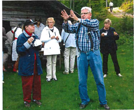
Några av alla de evenemang som anordnats av hembygdspöreningarna i Dalarna sommaren 2015.