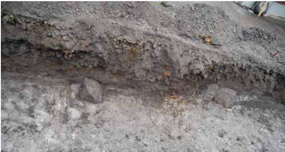
Figur 5. Översiktsbild av stenarna i schakt 2. Bilden tagen från norr.

var 0,2 meter med slagg blandad med träflis och annat organiskt material. Under det 0,1 meter med brun jord och 0,1 meter ljusbrun torr lera. Sedan 0,1 meter med slagg och 0,1 meter med grå lera. I botten var det ljusbeige lera.