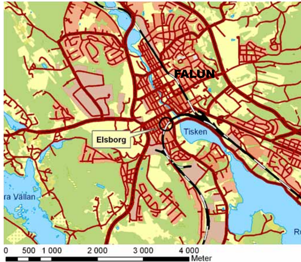
Figur 1. Utdrag ur fastighetskartan med det aktuella området inringat. Skala 1:50 000.

Syftet med den arkeologiska förundersökningen var att närmare klargöra fornlämningsförhållandena inom exploateringsområdet samt bilda underlag för beräkning av omfattning och kostnad för en eventuell särskild arkeologisk undersökning i samband med tillåtlighetsprövning enligt 2 kap 12 § KML.