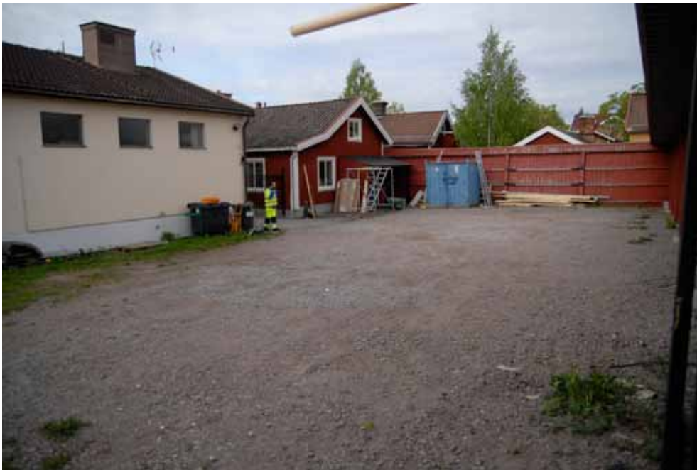
Figur 3. Översiktsbild av gårdsplanen innan schaktningen började. Bilden tagen från nordöst med Greger Bennström i bakgrunden.

1952 i södra delen av tomten i samband med att en större byggnad uppfördes på Assessorn 12. Vid byggandet av carporten längs tomtens norra gräns grävdes minst 8 plintar ner.