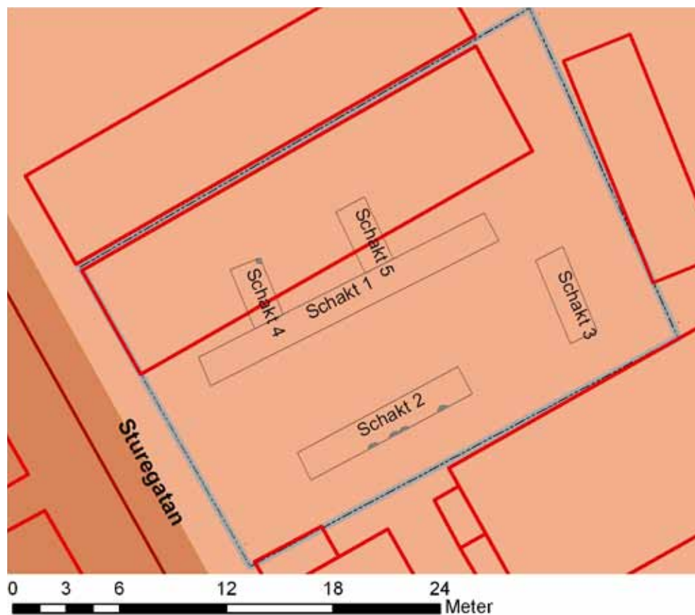
Figur 4. Utdrag ur fastighetskartan med undersökningsområdet och schakten markerade. Längs schakt 2 sydöstra kant syns stenar likson i norra hörnet i schakt 4. Skala 1:200.