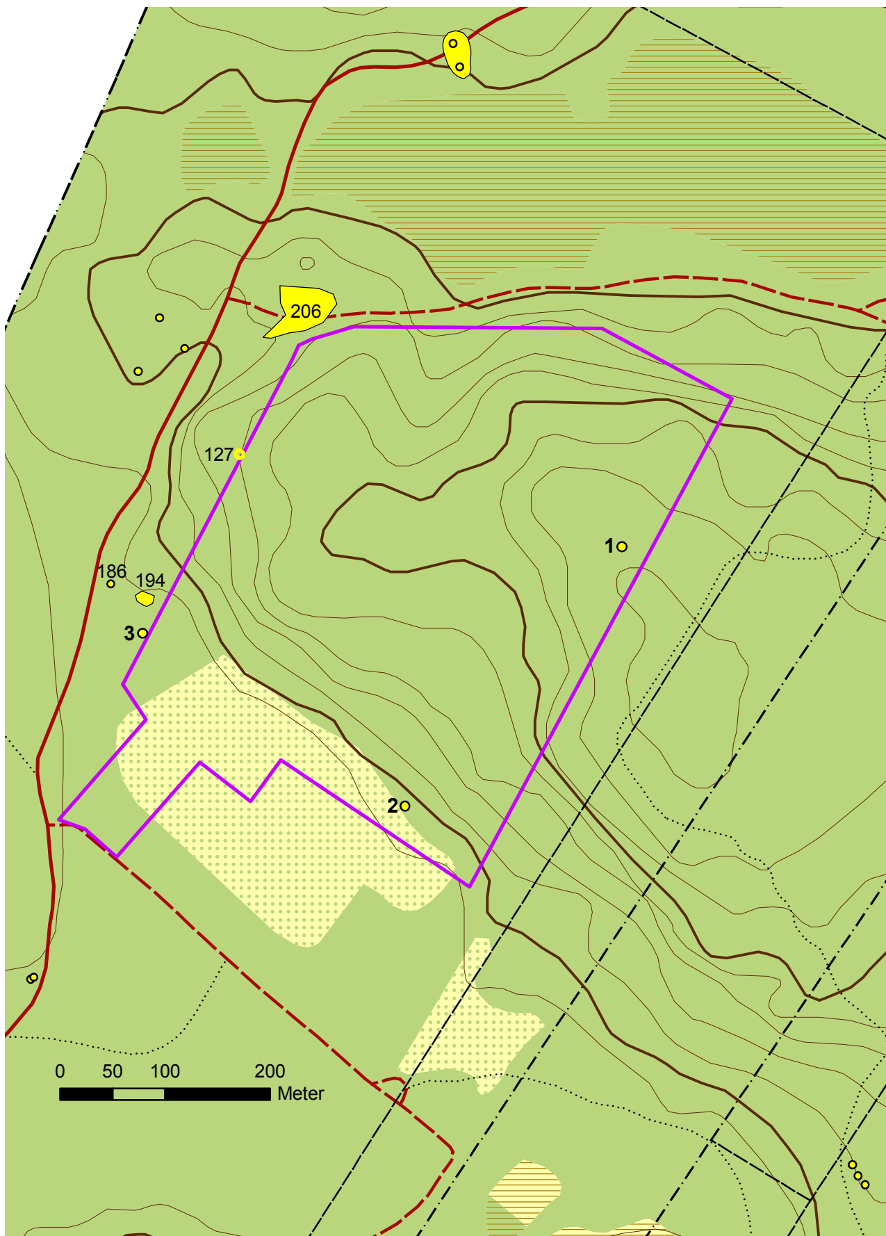
Figur 2. Utdrag ut fastighetskartan med utredningsområdet markerat med lila och de i texten omnämnda lämningarna markerade med respektive nummer. Skala 1:5 000.