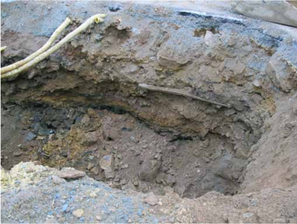
Figur 4. Västra delen av schaktet. Observera trävirket och att schaktet delvis är igenrasat. Fotograferat från nordöst.