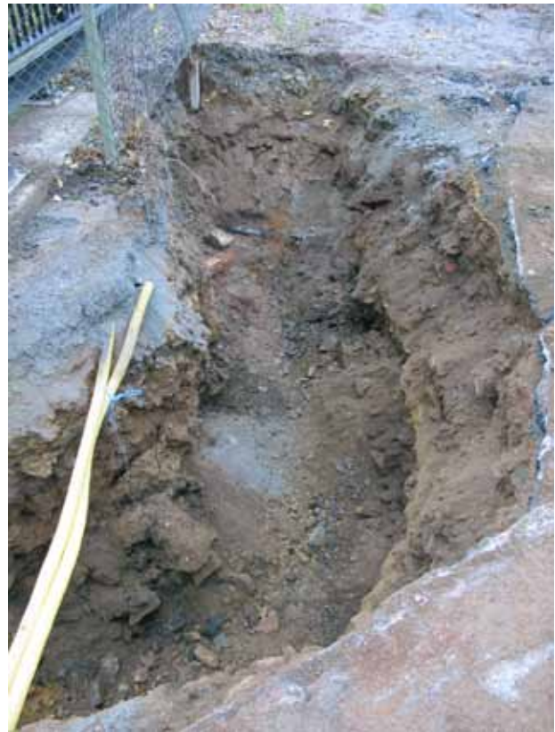
Figur 3. Nordöstra delen av schaktet. Fotograferat från sydöst.

med att avloppsledningen runt Rödfärgsverket lades om. Övervakningen omfattade dock inte aktuell sträcka. Sydväst om byggnaderna anträffades rester av flera timmerkonstruktioner (Lögqvist 2004).