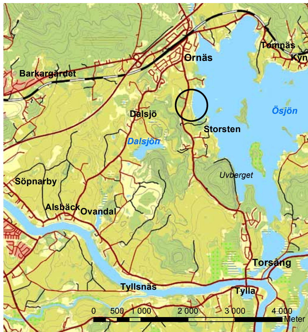
Figur 1. Utsnitt ur fastighetskartan med det aktuella exploateringsområdet inom den svarta ringen. Skala 1:50 000.

Inom berörda fastigheter finns en blästbrukslämning samt en boplats registrerade, RAÄ-nr 23:1 respektive 130:1, Torsång socken.