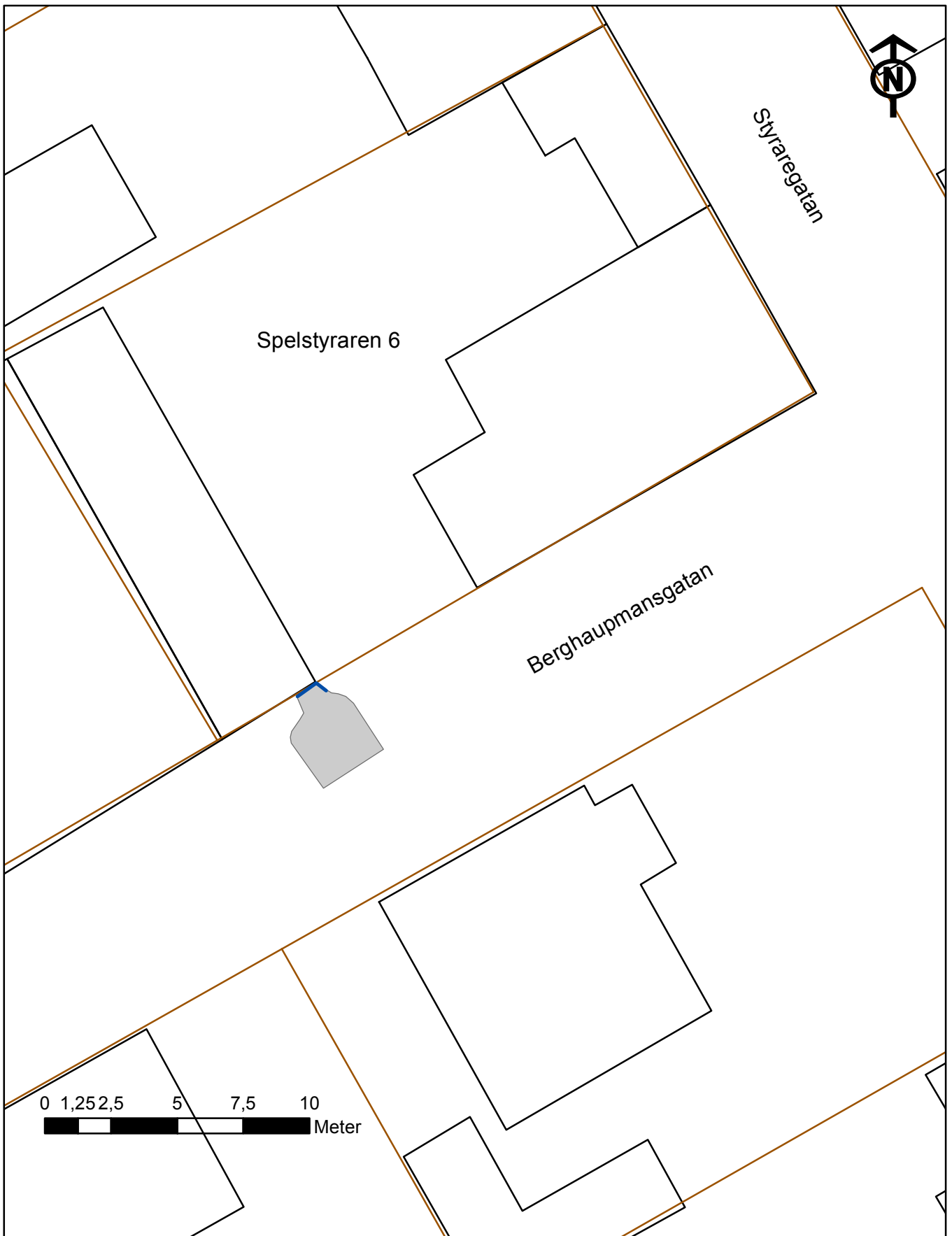
Bilaga 2. Schaktet vid fastigheten Spelstyraren 6 markerat med grått. De synliga kulturlagren markerade med blå linje. Skala 1:200