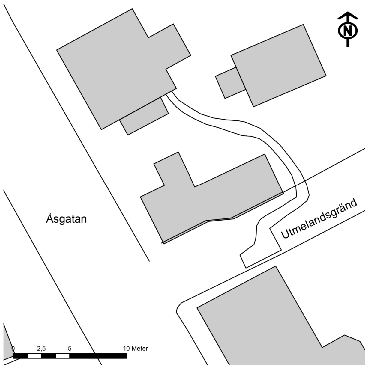
Bilaga 2. Utdrag ur fastighetskartan med schaktet markerat. Skala 1:200.