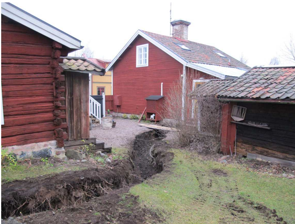
Bilaga 5. Den norra delen av schaktet. Foto från SÖ, Joakim Wehlin.