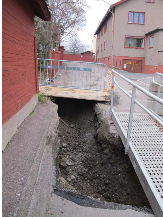
Bilaga 3. Den södra delen av schaktet. Foto från SV, Joakim Wehlin.