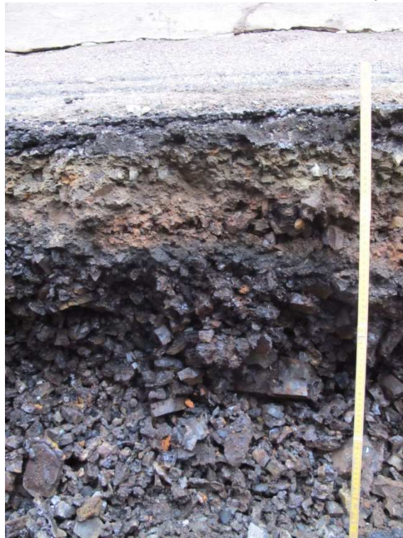
Bilaga 4. Slagglagren under vägen vid Utmelandsgränd.