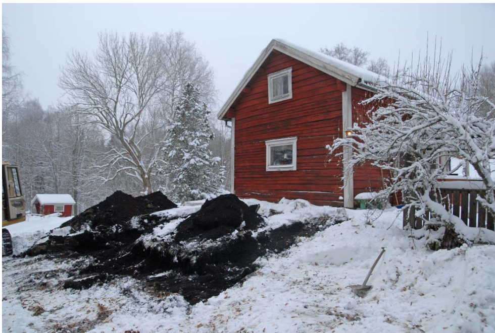
Figur 1. Schaktningen i Pålsbenning skedde i sluttningen öster om fritidshuset.

Syftet var att med ett vetenskapligt arbetssätt dokumentera fornlämningen.