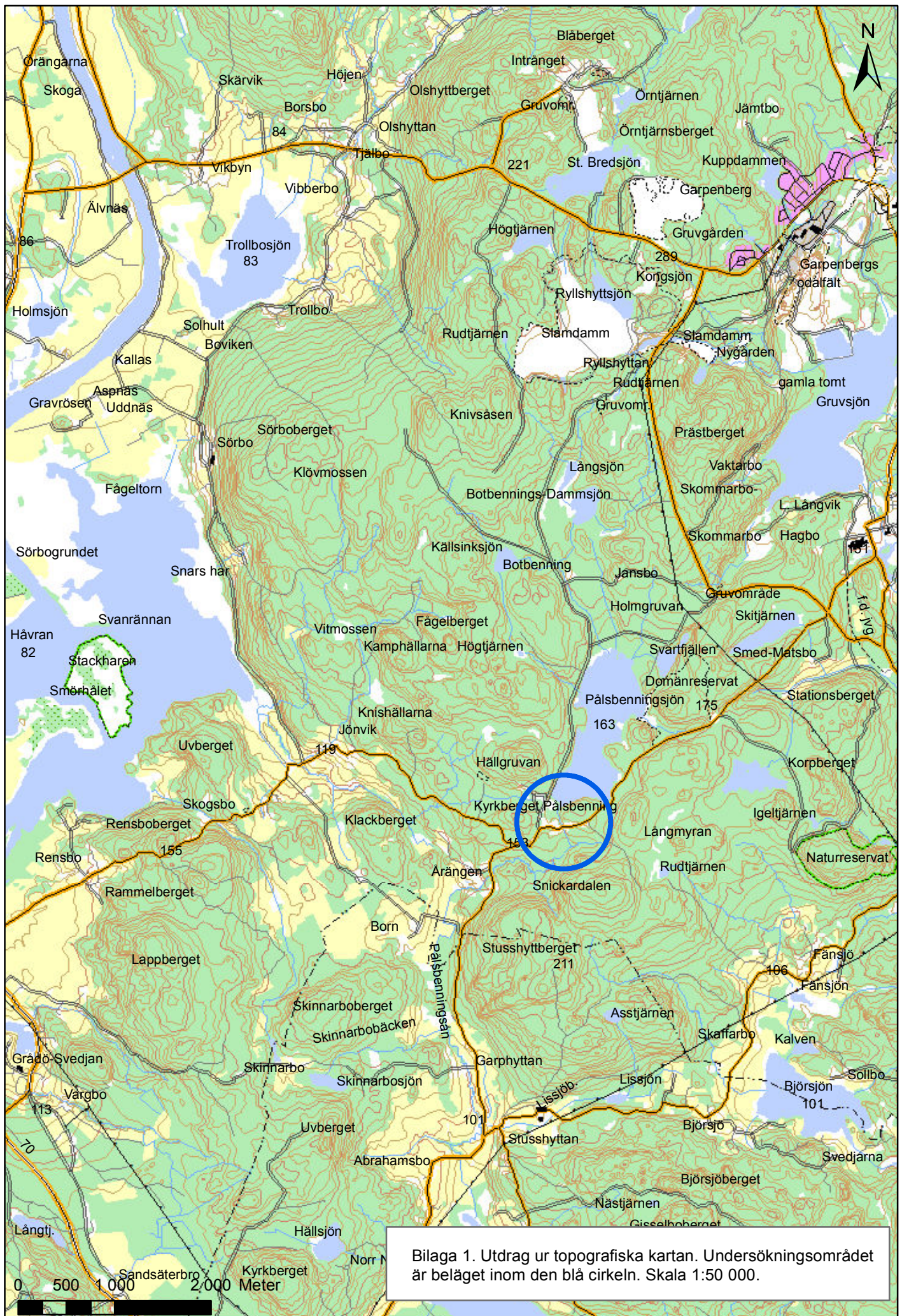
Bilaga 1. Utdrag ur topografiska kartan. Undersökningsområdet är beläget inom den blå cirkeln. Skala 1:50 000.