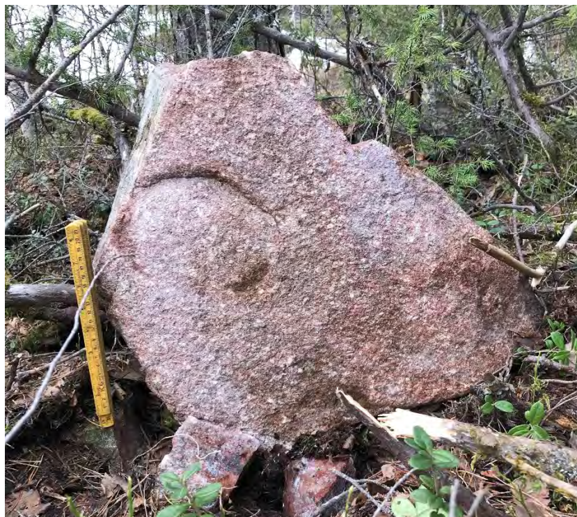
Foto 1. En bit röd granit med "huggen" oval på ena sidan. Möjligen en del av kilometerstenen L2000:5287.