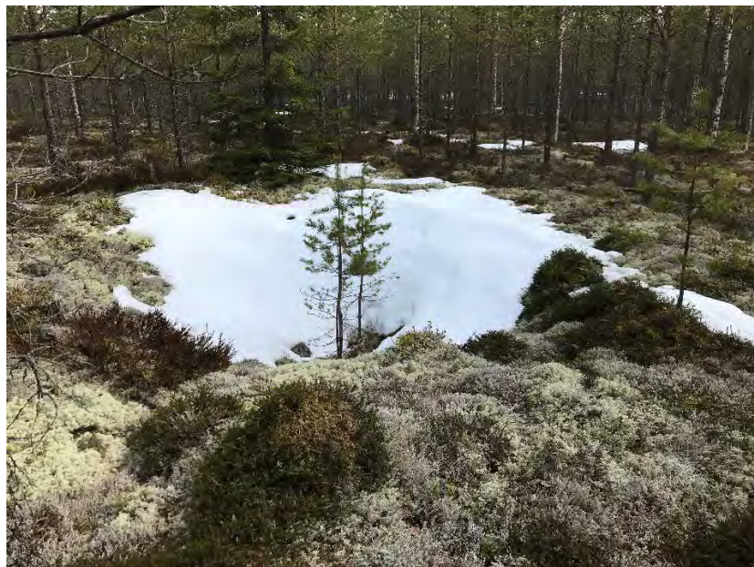
Foto 4. Den delvis snöfyllda fångstgropen L2023:3593.