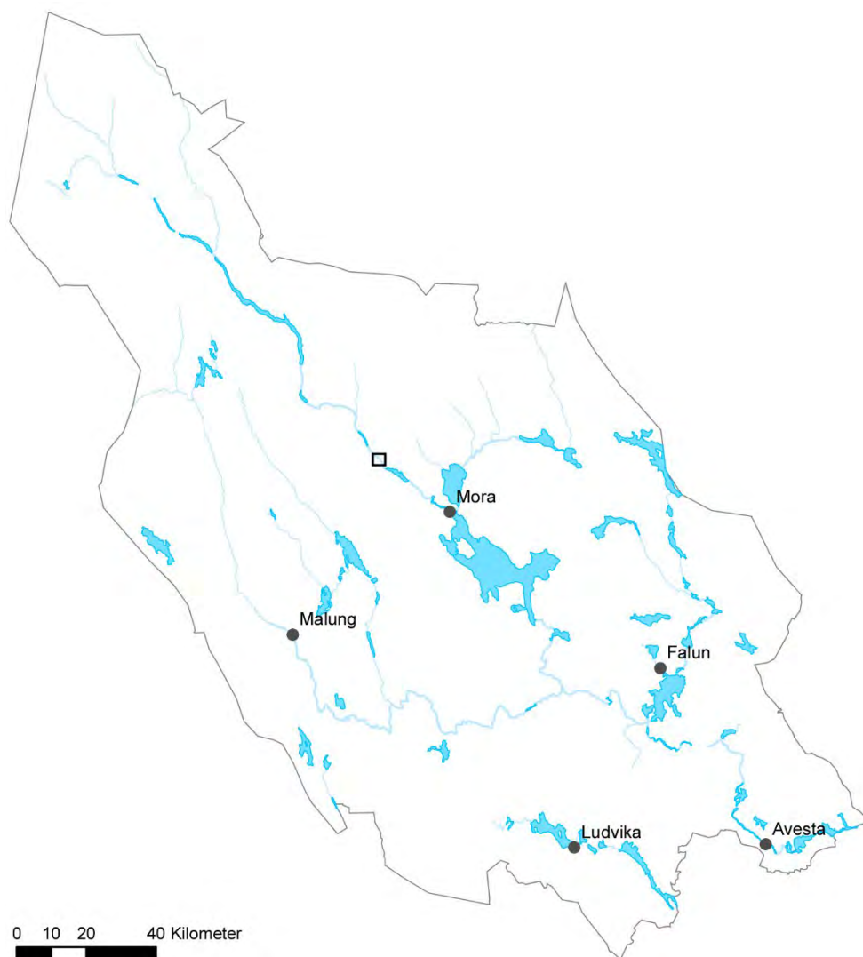
Karta över Dalarna med utredningsområdet inom den svarta rektangeln.