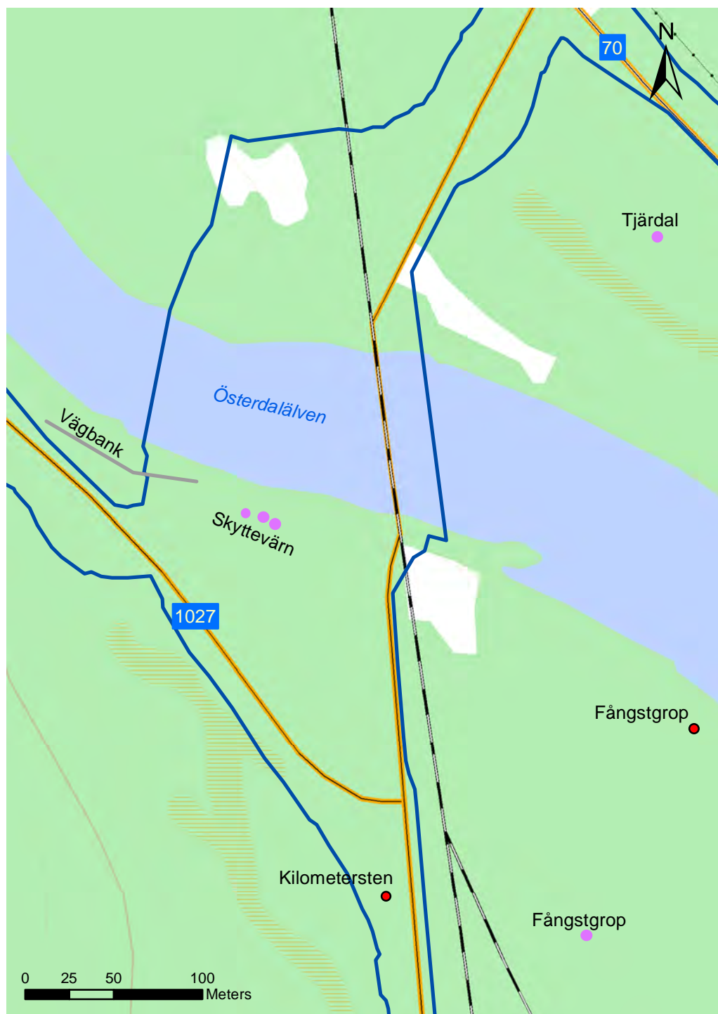
Figur 3. Utsnitt från terrängkartan med utredningsområdet inom den blå linjen, nyupptäckta lämningar markerade med lila och befintliga lämningar markerade med rött. Skala 1:3000.