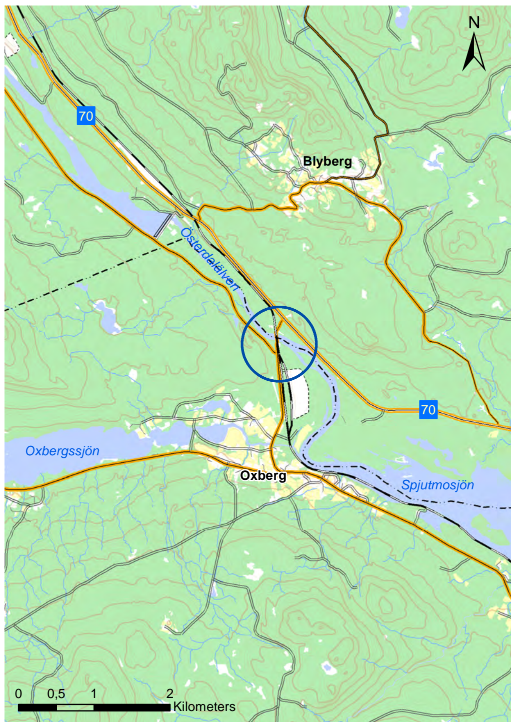
Figur 1. Utsnitt från terrängkartan med utredningsområdet inom den blå cirkeln. Skala 1:50 000.