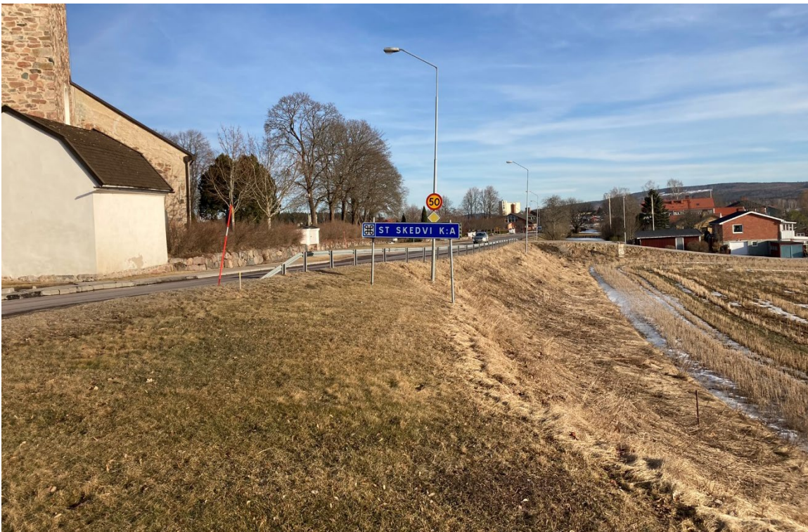
Foto 4: Område utvalt för sökschaktning söder om Stora Skedvi kyrka från nordväst.