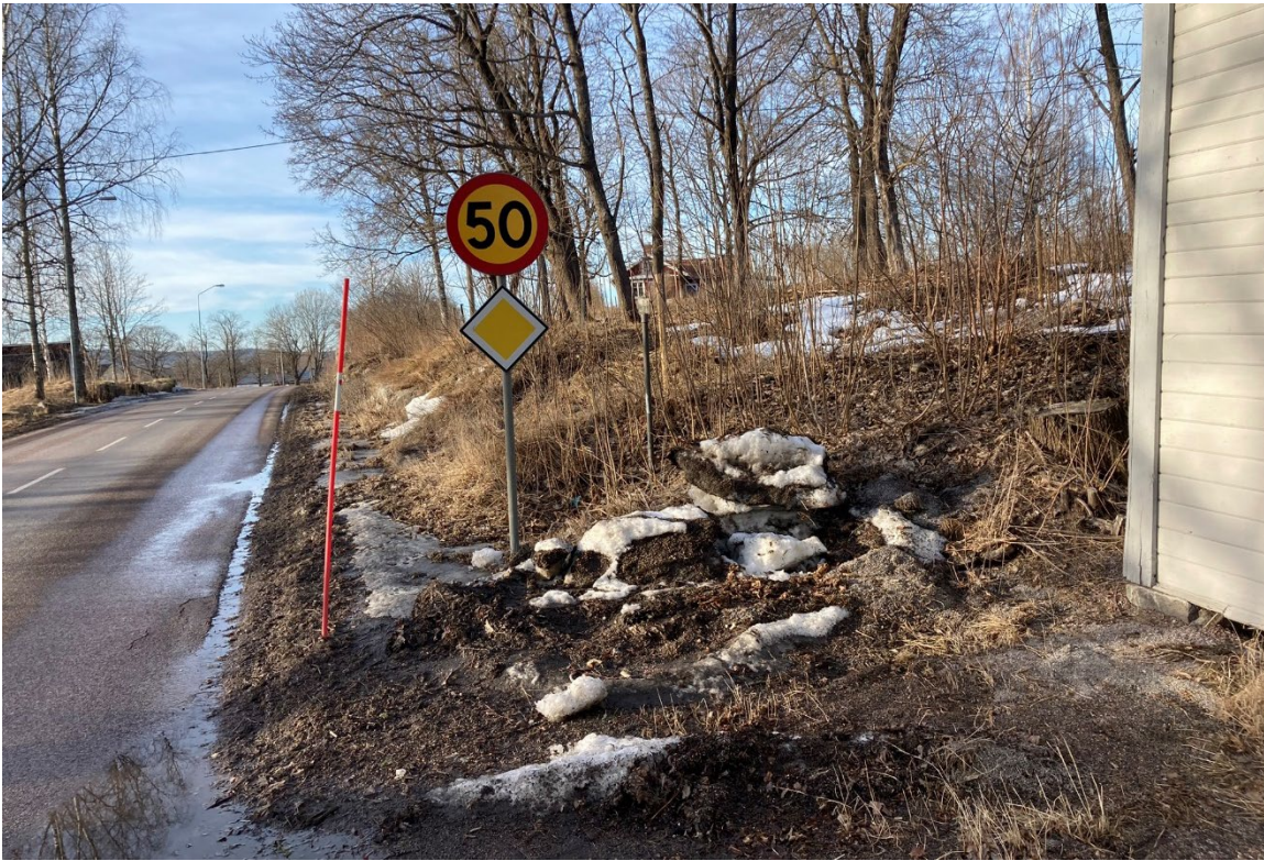
Foto 1: Område utvalt för sökschaktning nordöst om vägen fotat från sydöst.