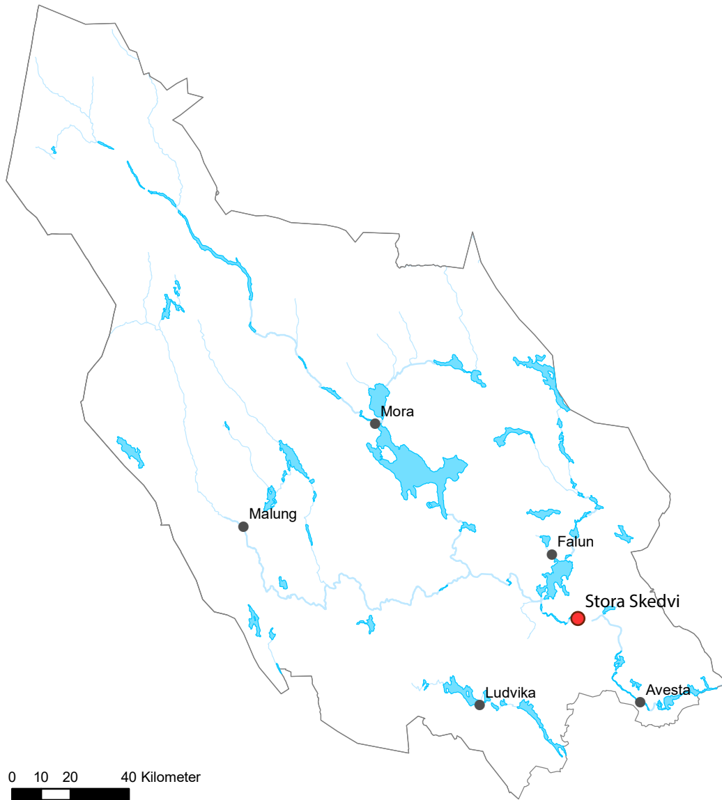
Figur 1. Karta över Dalarna med Stora Skedvi markerat.