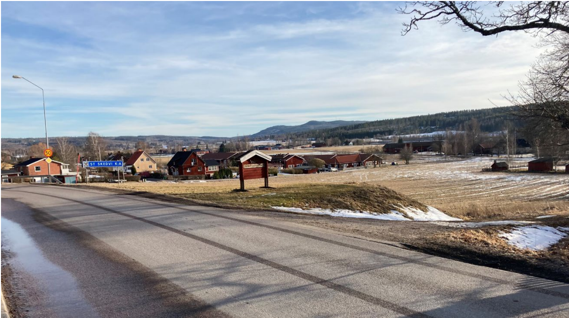
Foto 3: Området söder om Stora Skedvi kyrka från norr.