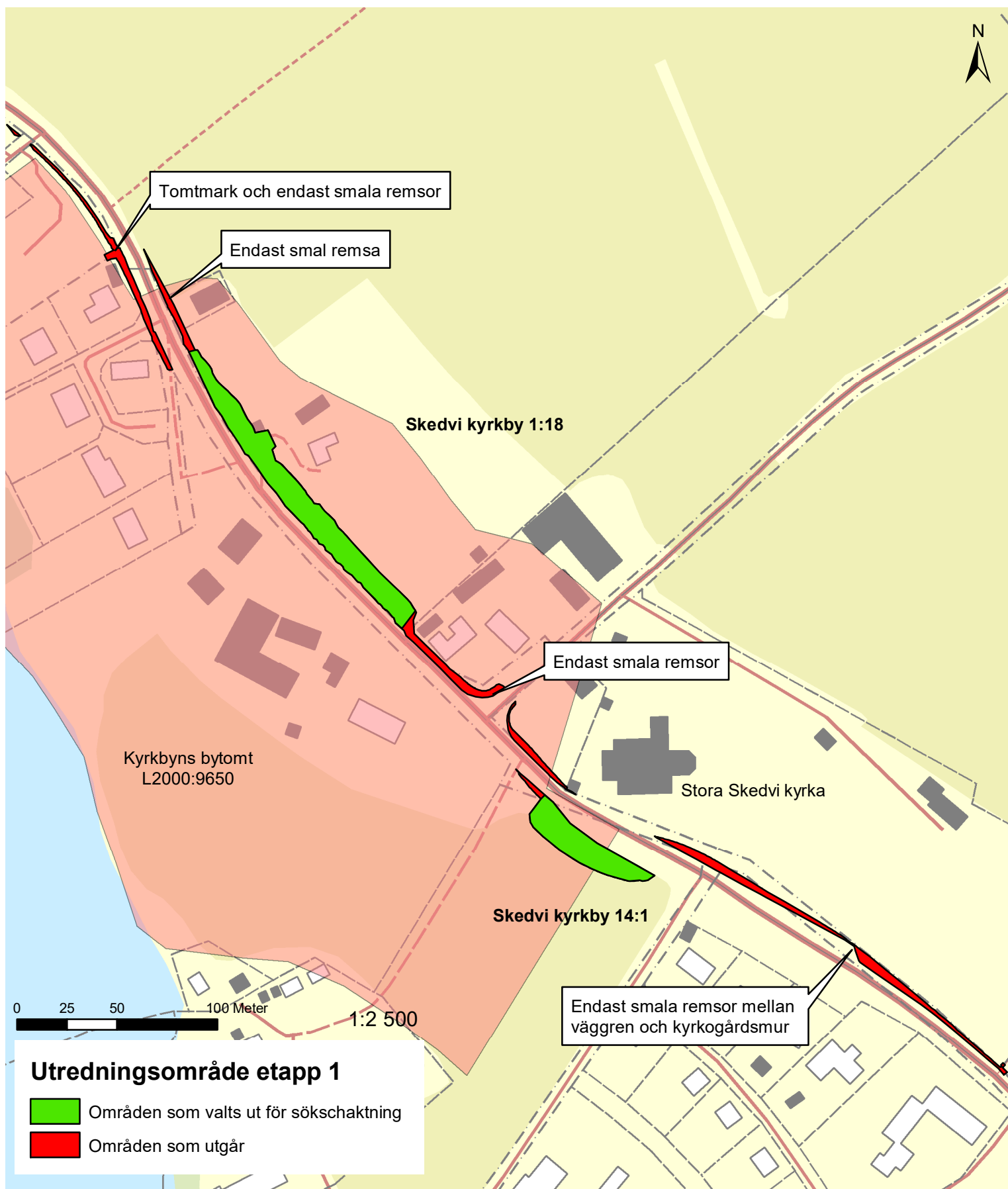
Figur 3. Utdrag ur fastighetskartan med utredningsområdet markerat. Röda ytor bedömdes ej relevanta att gräva sökschakt på. Det registrerade området för Kyrkbyns bytomt L2000:9650 markerat med ljusrött. Skala 1:2500.