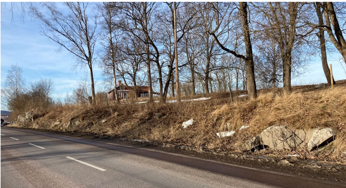
Foto 2: Område utvalt för sökschaktning nordöst om vägen fotat från syd.