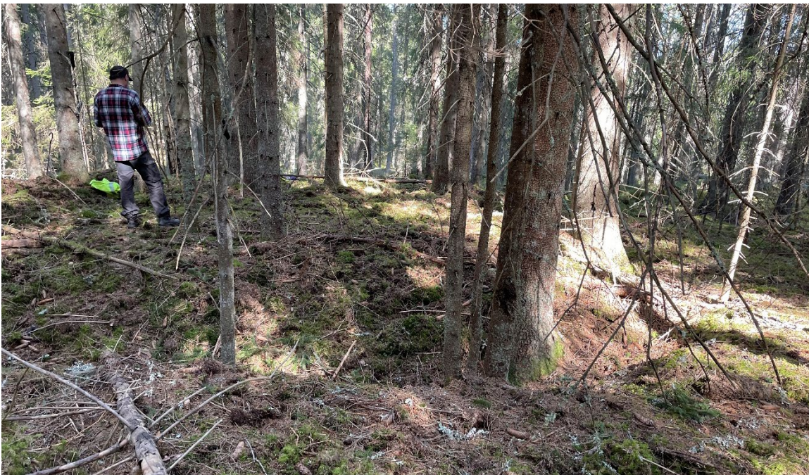
Foto 3. Greger står på ytan för liggmilan, L2023:1395. I förgrunden och till höger i bild kan diket skönjas. Foto mot söder.