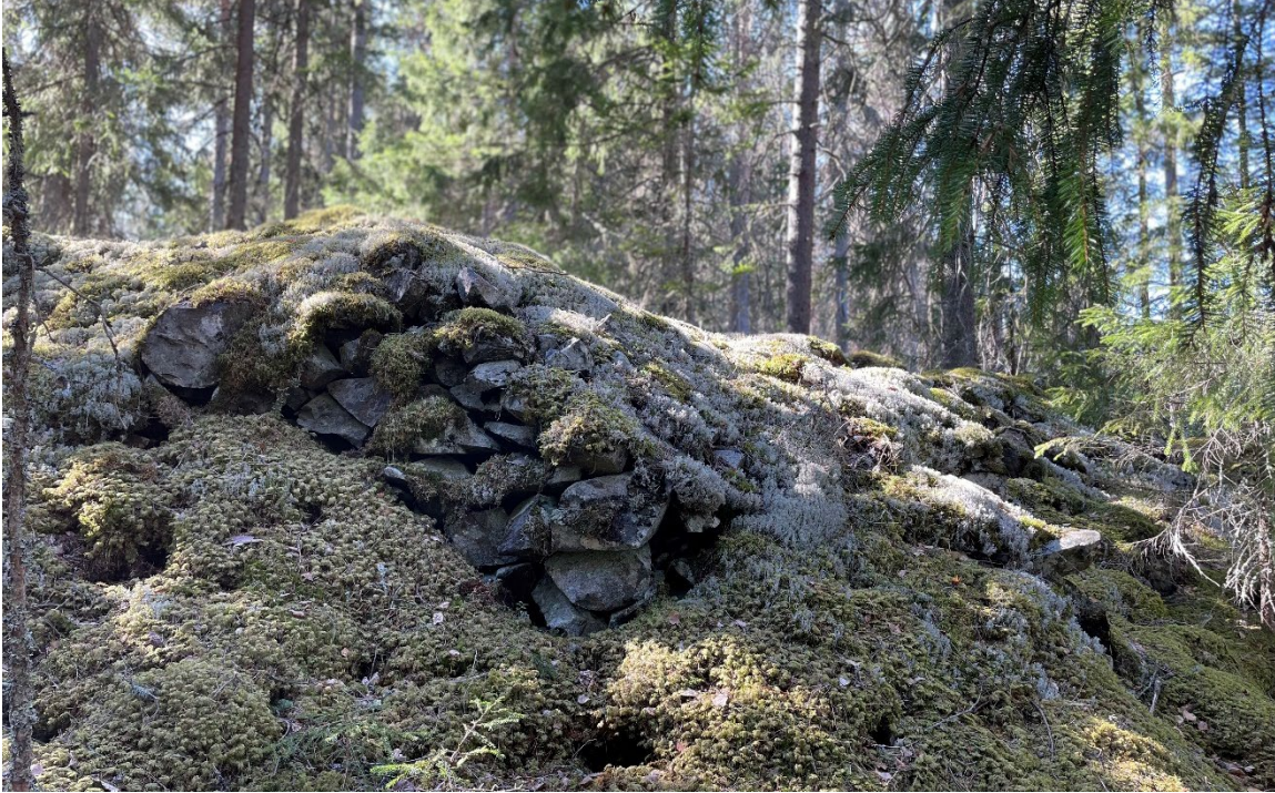
Foto 2. Kallmurad gråbergsvarp i gruvområdets norra del. Foto mot norr.