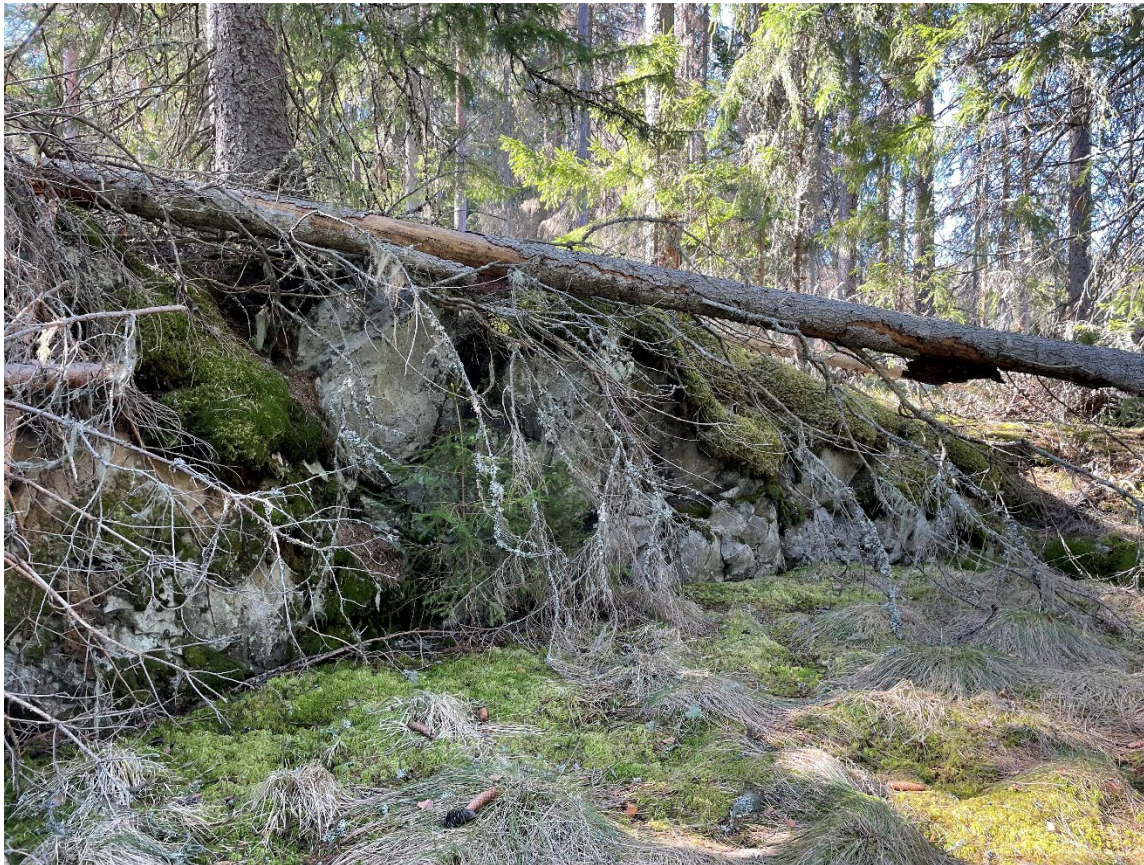
Foto 1. Brottytan, gruvområde L2023:1394. På bergväggen syns typiska spår av tillmakning i form av välvda relativt släta brottytor. Foto från nordöst.