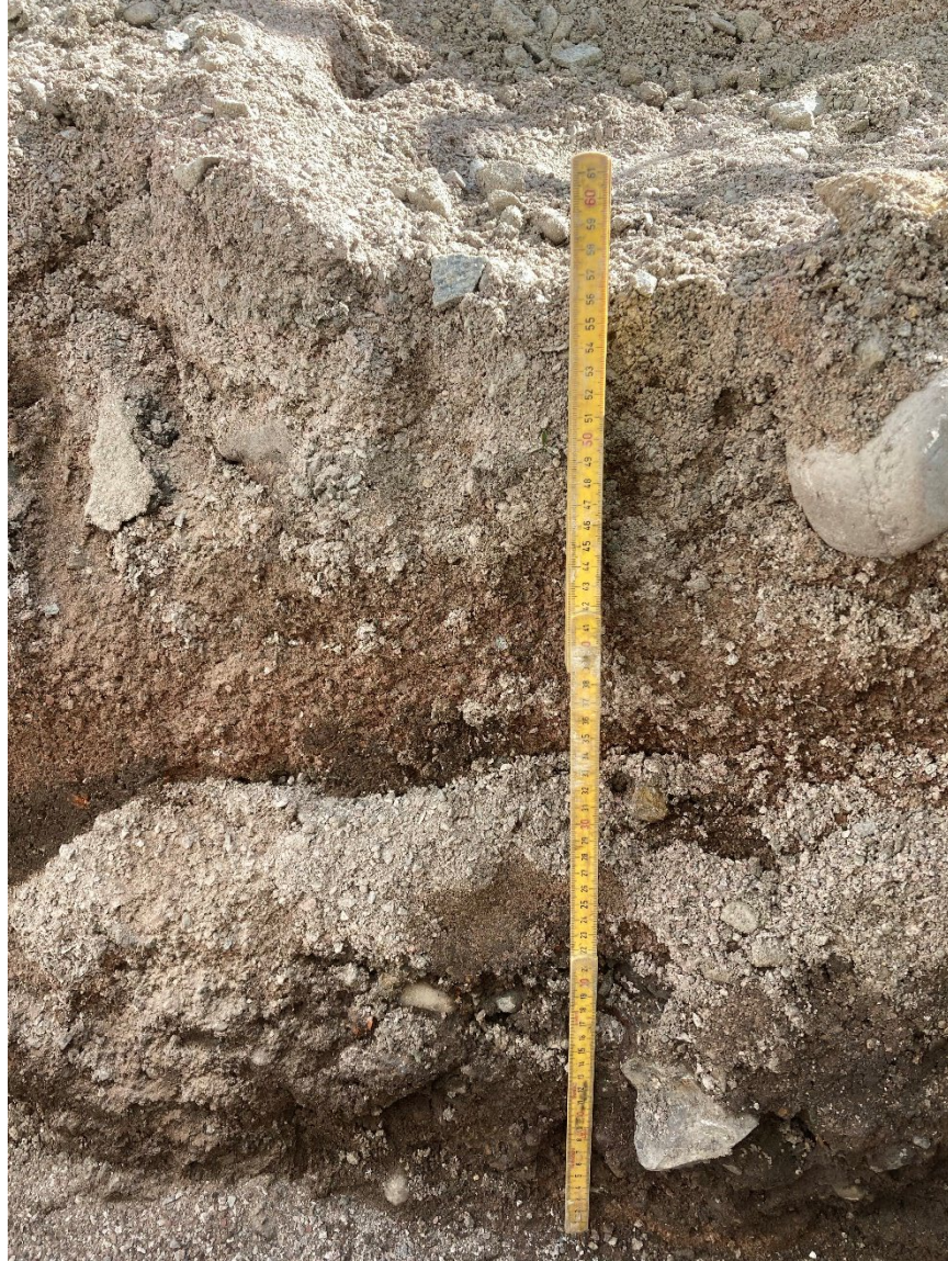
Foto 2: Nordöstra schaktväggen där det var som djupast. Vid den punkt där höjdmått för marknivån markerats på figur 2.