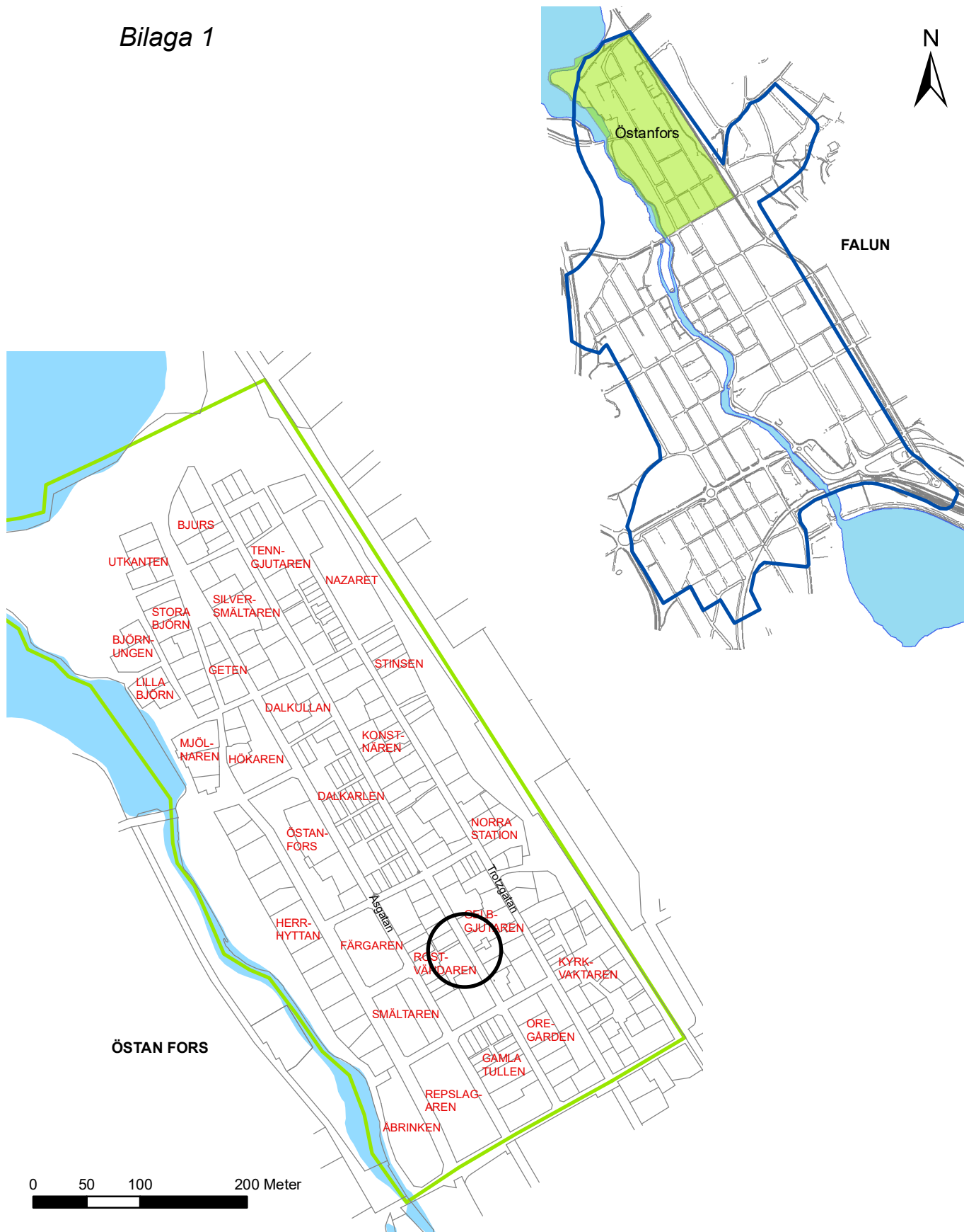
Figur 1: Karta över Falu stadslager (blå markering) och stadsdelen Östanfors (grön markering). Den svarta cirkeln markerar platsen för schaktningsövervakningen.