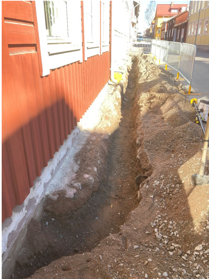
Foto 1: Översikt schakt. Fotat från sydöst.