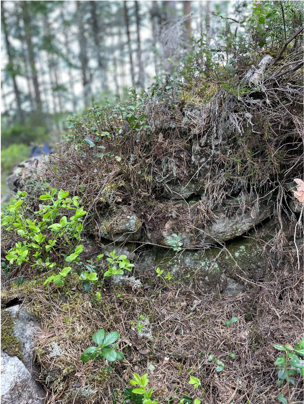
Foto 3: Närbild på det kallmurade spismursröset i L2023:2426. Foto från öst.