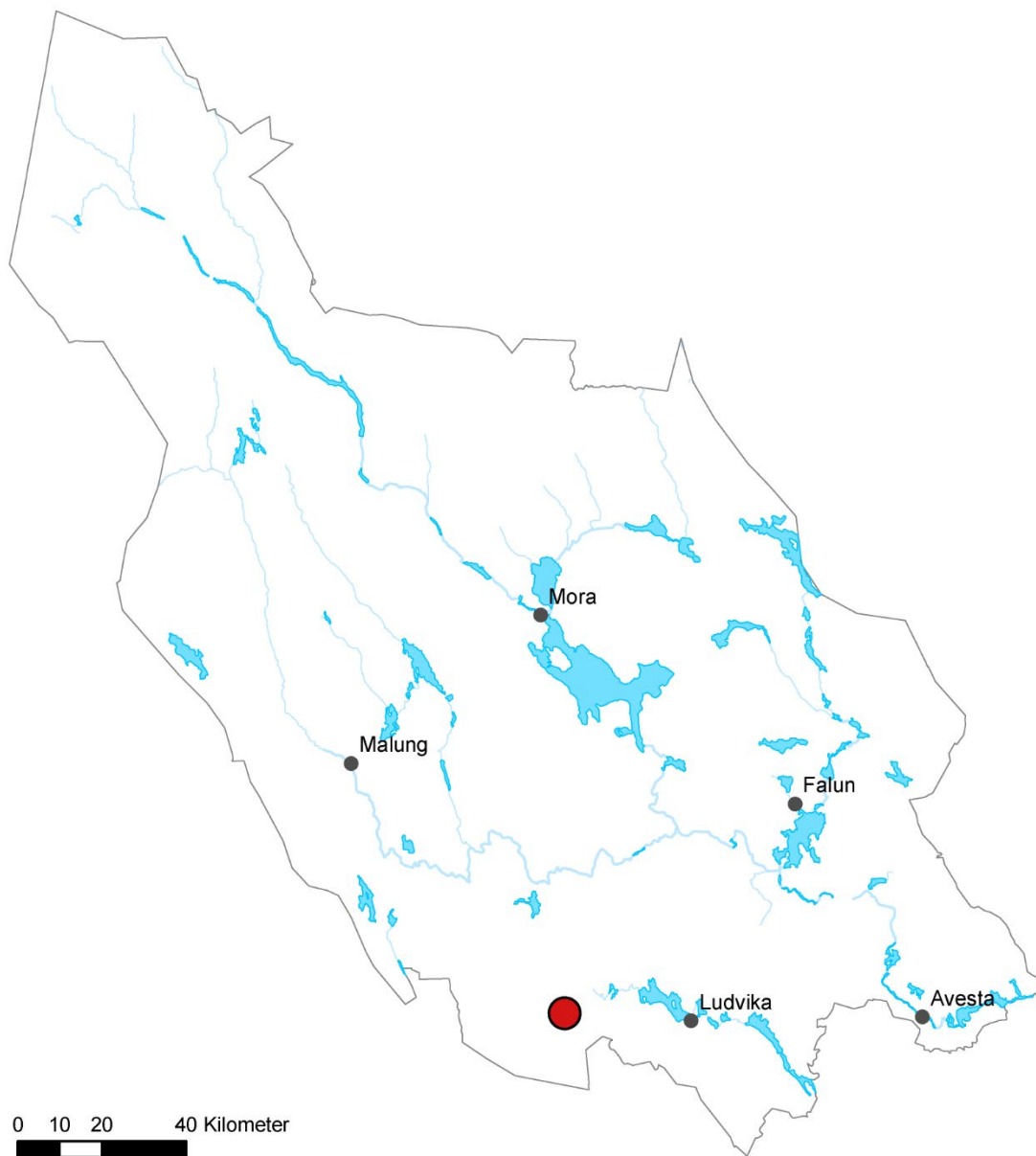
Figur 1: Översikt över Dalarna. Utredningsplatsen vid Pajsöberget markerad med röd prick.