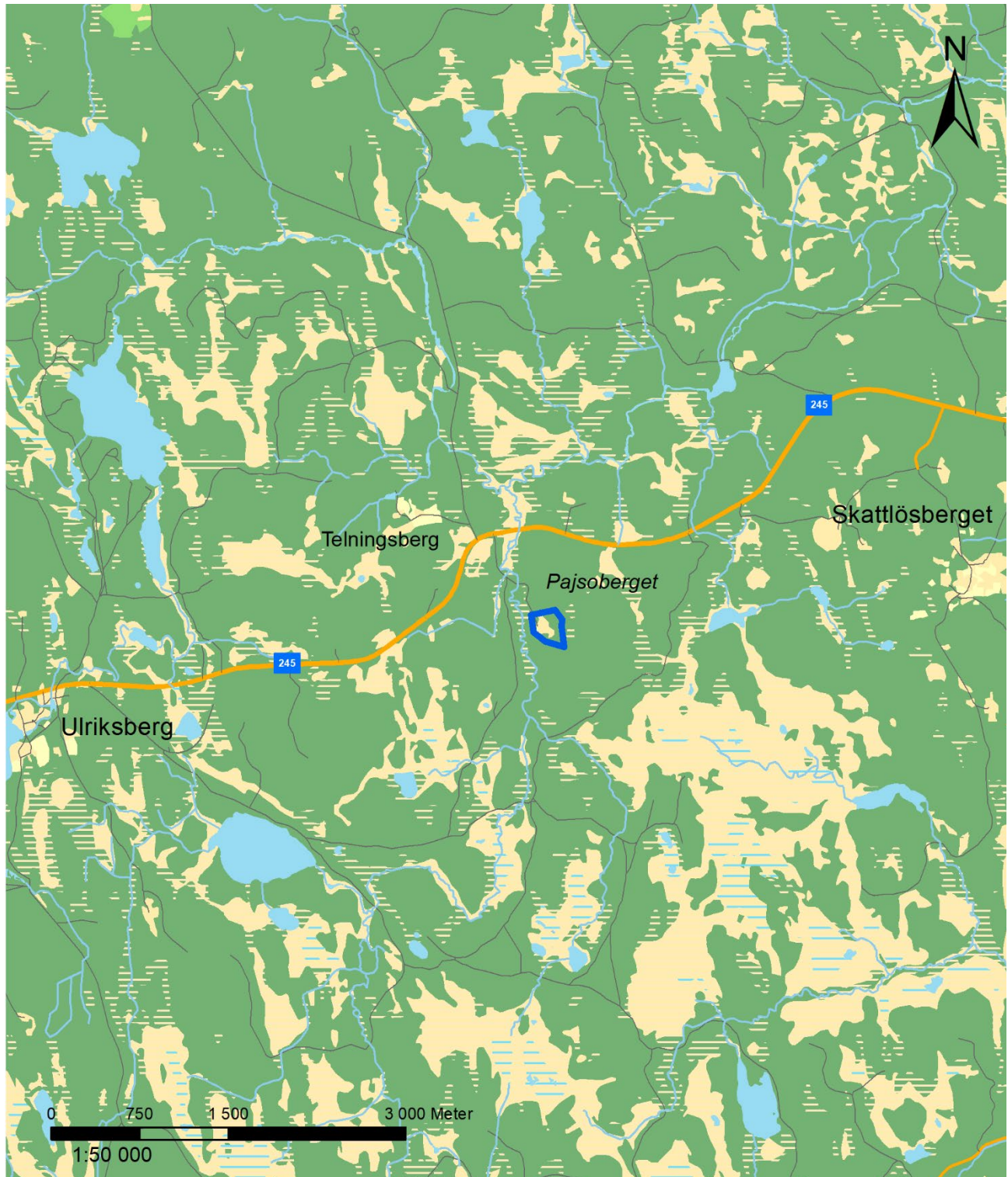
Figur 2: Utdrag ur terrängkartan. Utredningsområdet vid bergtälten markerad med blått.