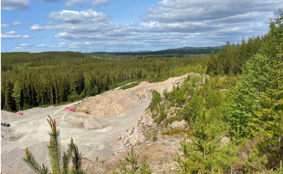
Foto 1: Översikt över bergtäkten. Foto från sydöst.