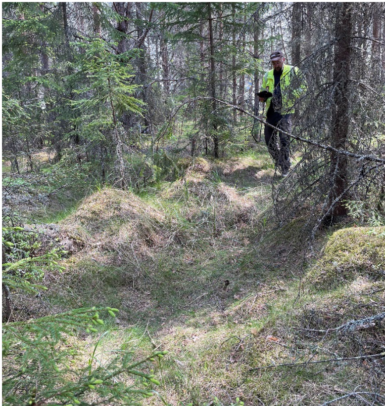
Foto 2: I förgrunden syns en av de oregelbundna täktgroparna vid L2023:2423. Foto från sydväst.