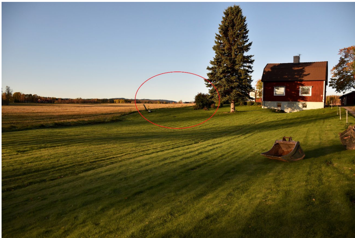
Foto 1. Översikt, Tylla 6:1. Den registrerade lämningen, L1999:4023 ligger ungefär inom den röda markeringen. Från NÖ.