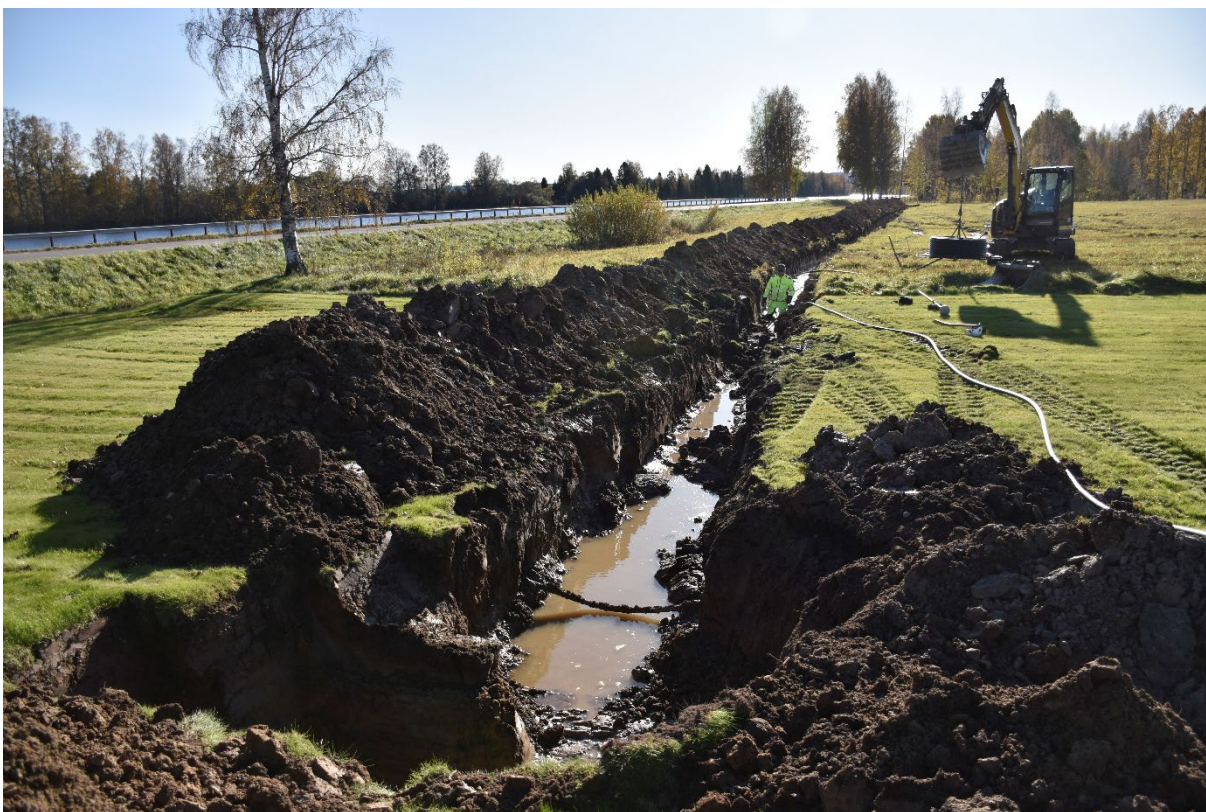
Foto 3. Översikt schakt 1. Den vattenfyllda delen i N, inne på tomten. Från NV.