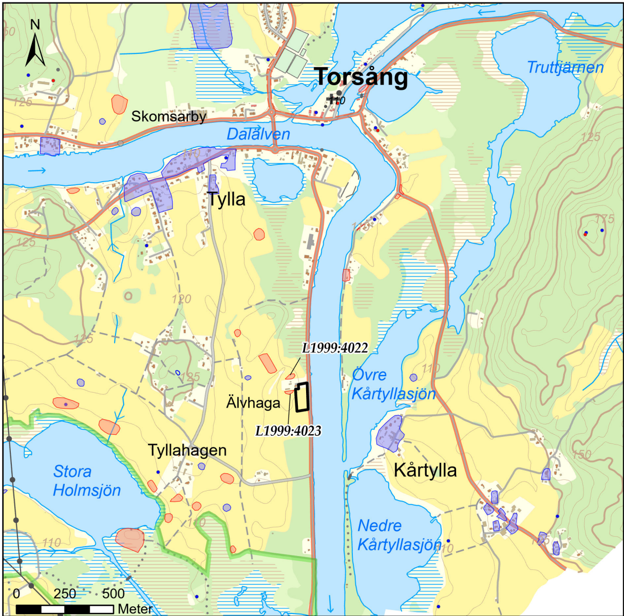
Figur 2. Utdrag ur topografiska kartan med undersökningsområdet markerat med svart. Skala 1: 20 000.