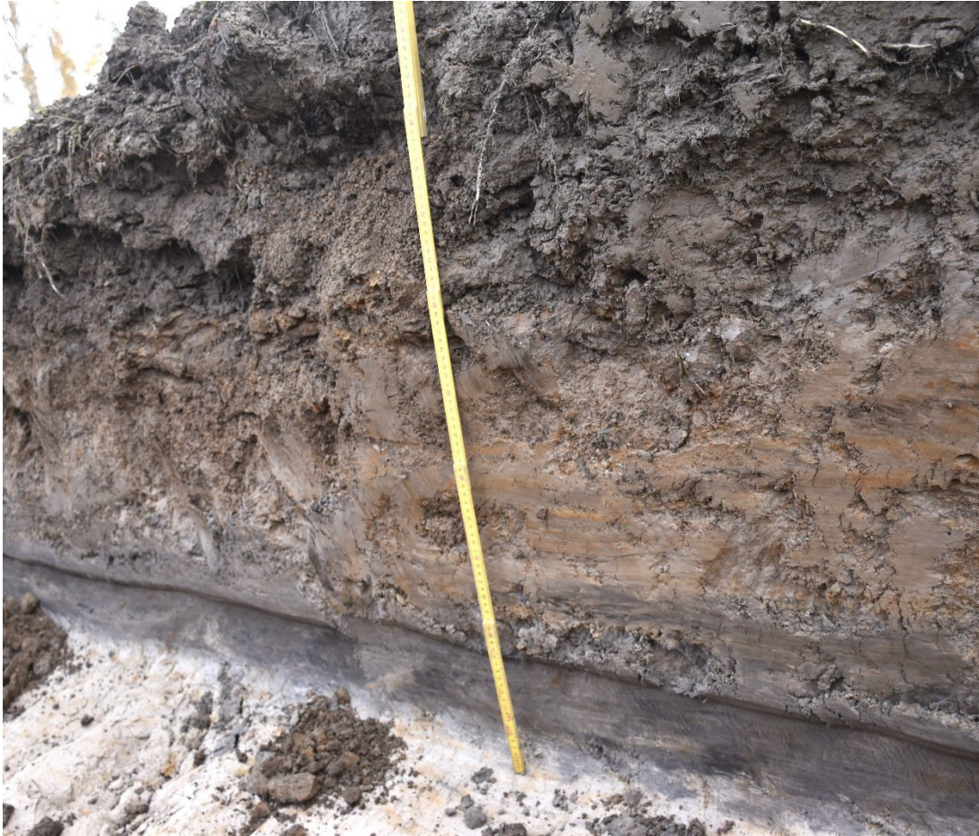
Foto 5. Del av östra schaktväggen i schakt 2 där man kan se gråbrun matjord i toppen, beige silt i mitten och det gråsvarta slamlagret i botten/nedre delen av schaktväggen. Från NV.