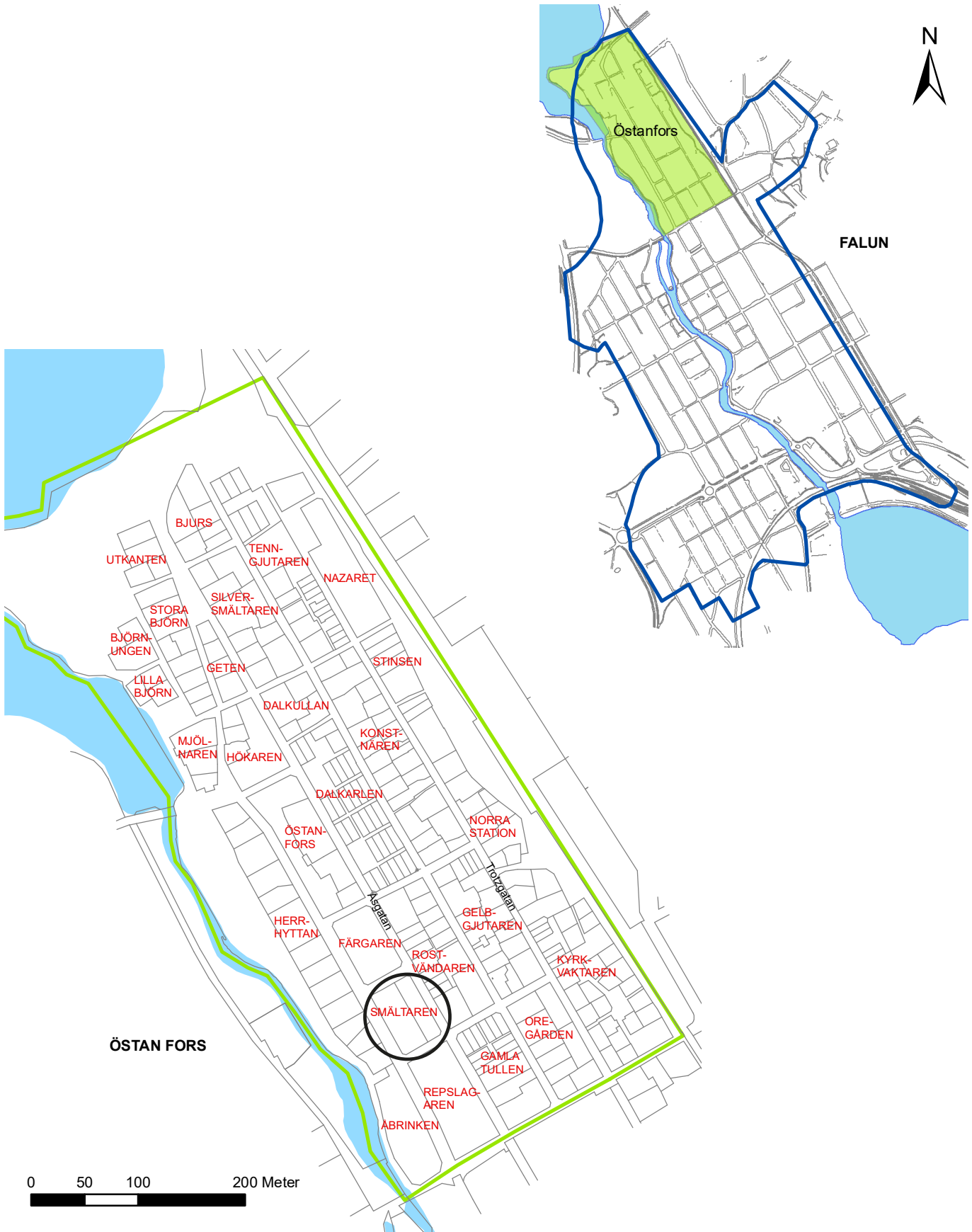
Figur 2. Karta över Falu stadslager (blått) och stadsdelen Östanfors (grönt) med undersökningsområdet markerat med svart cirkel.