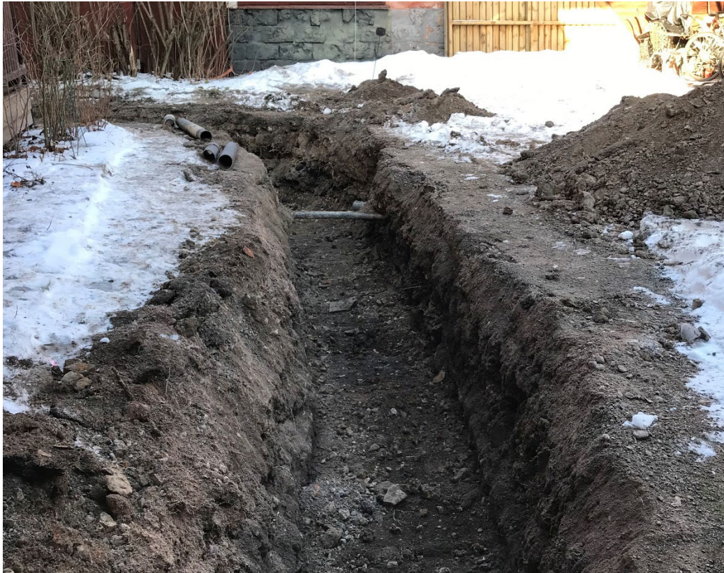
Foto 1. Översikt av del av schaktet inne på gården från sydost.