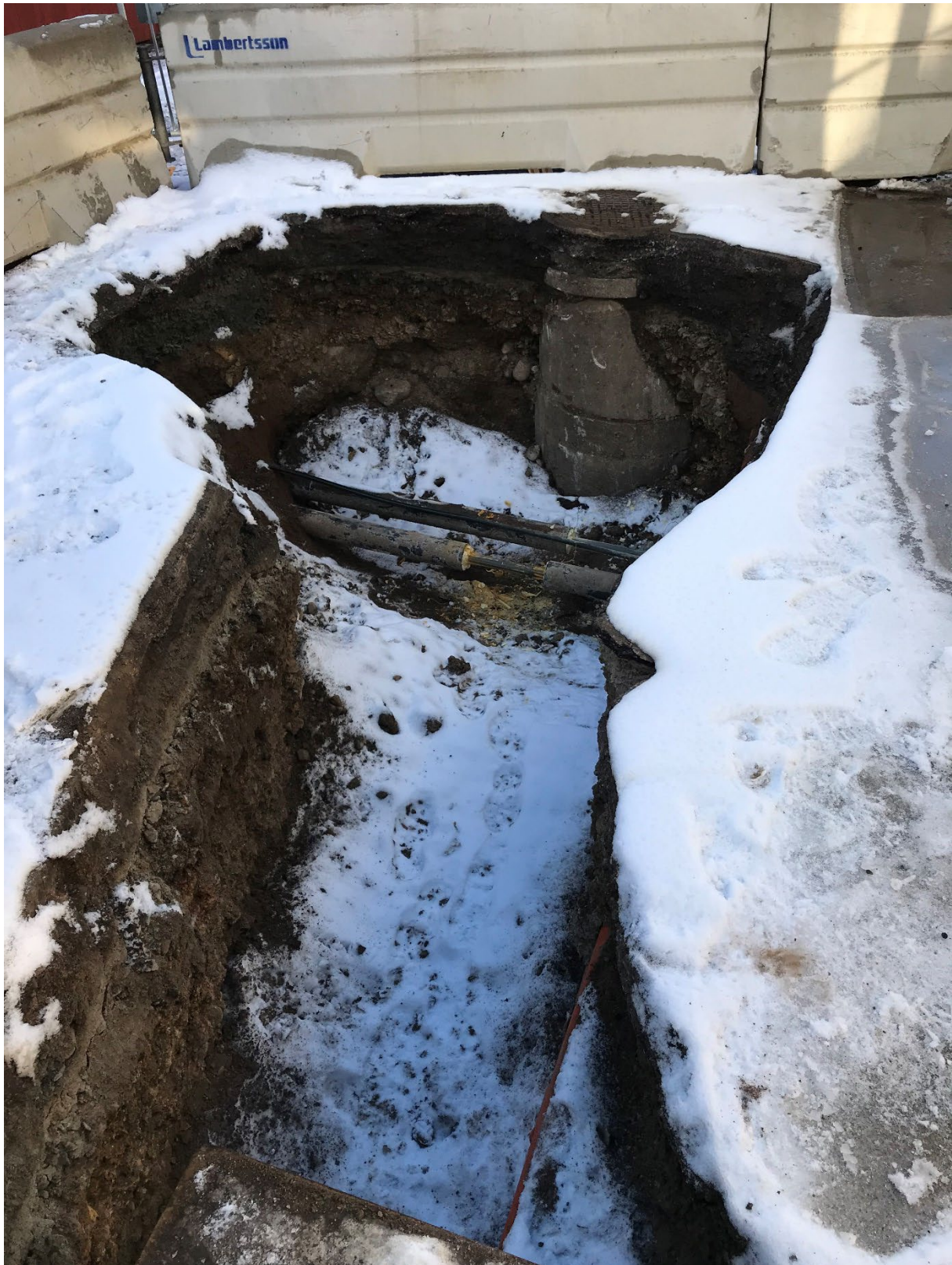
Foto 5. Översikt av del av schaktet ute i Åsgatan där anslutning skall ske. Från sydost.