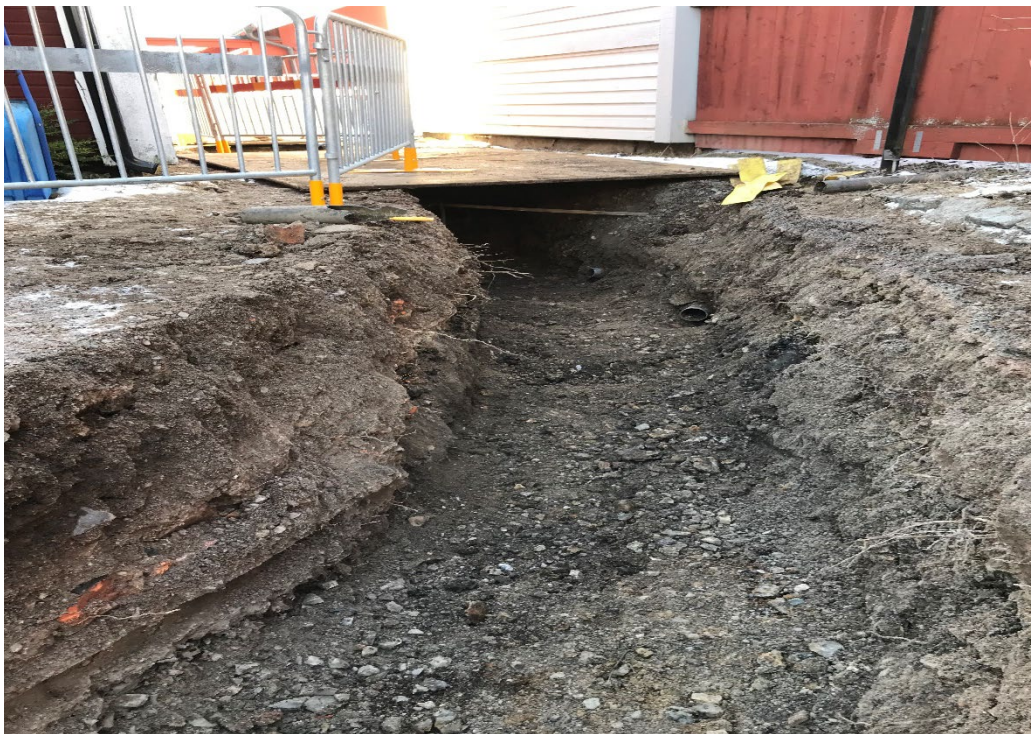
Foto 2. Schaktväggar och botten in mot huset. Överst noterades moderna fyllnadsmaterial (ljusgrått/brunt), och underst uppblandad slagg (mörkgrått/svart) med avtryck från tidigare rördragningar. Från öst.