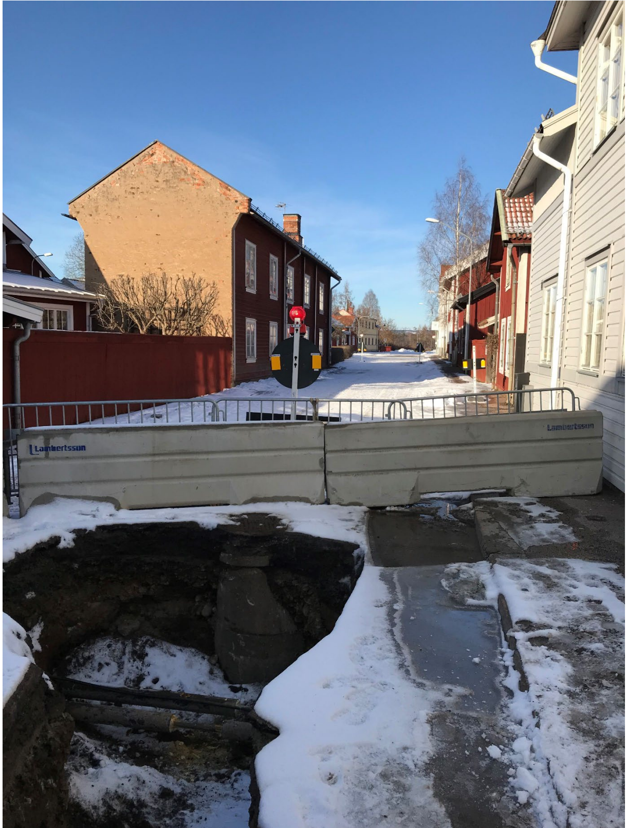
Foto 7. Översikt av del av schaktet ute i Åsgatan i förhållande till övrig bebyggelse. Från sydost.