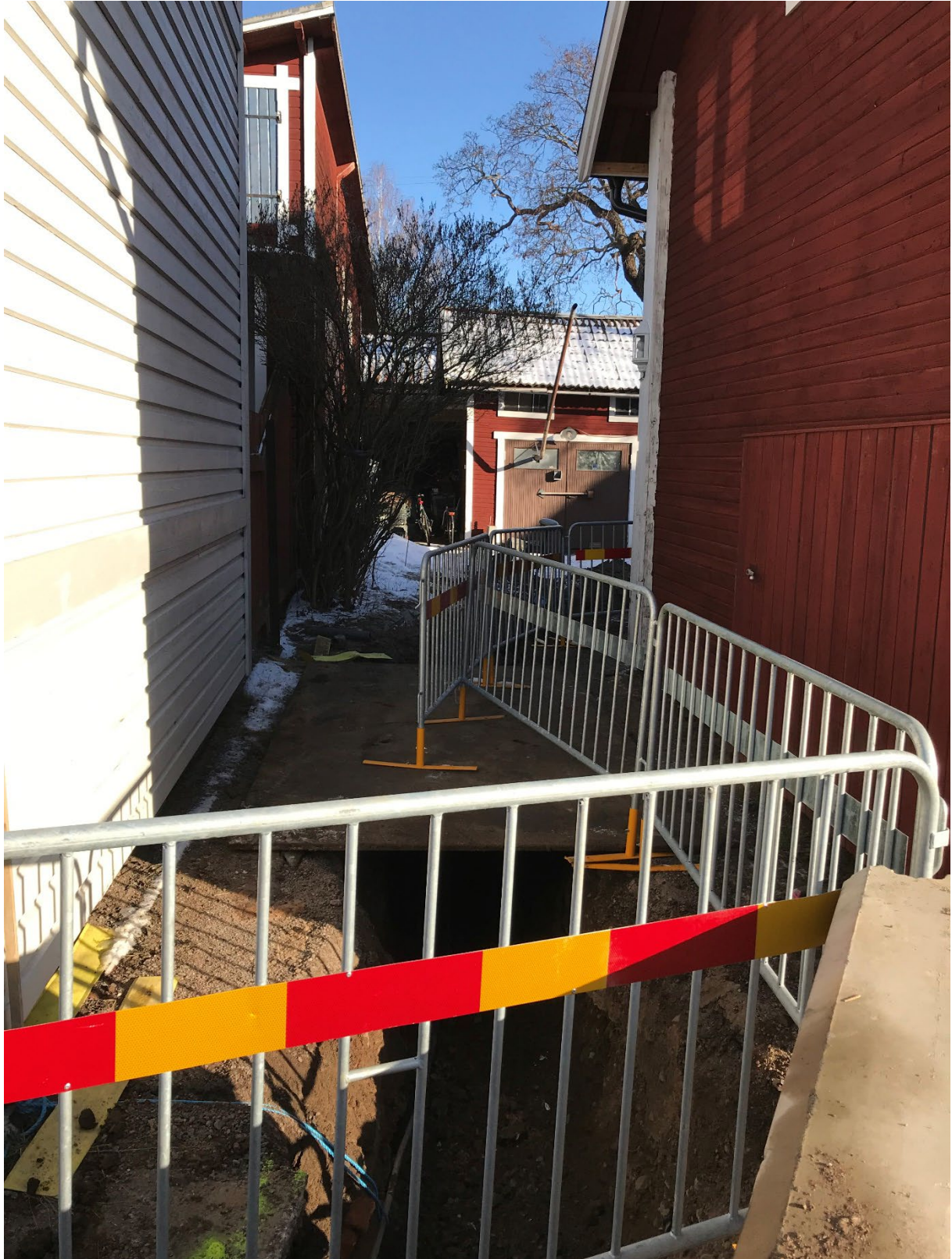
Foto 6. Översikt av del av schaktet mellan fastigheterna i riktning in mot gården från västsydväst.