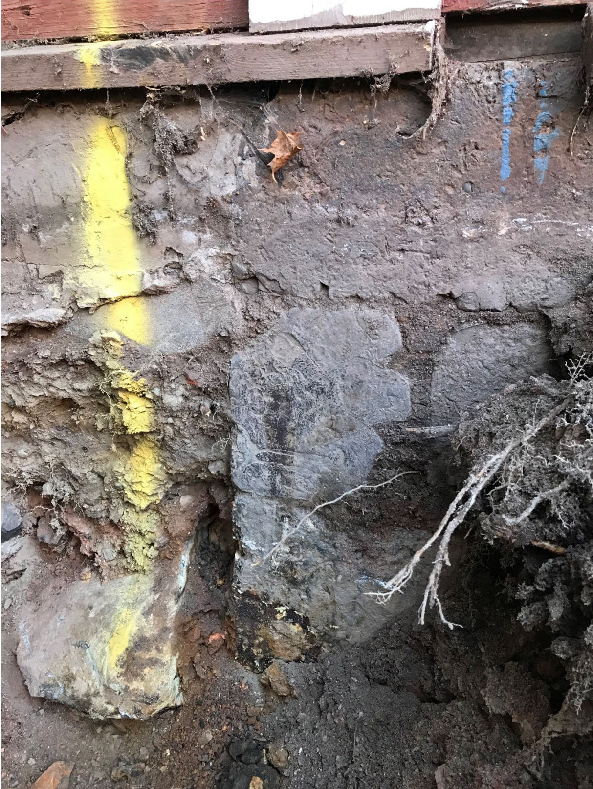
Foto 3. Översikt av husgrunden med slaggstensgrund inne på gården från nordost.