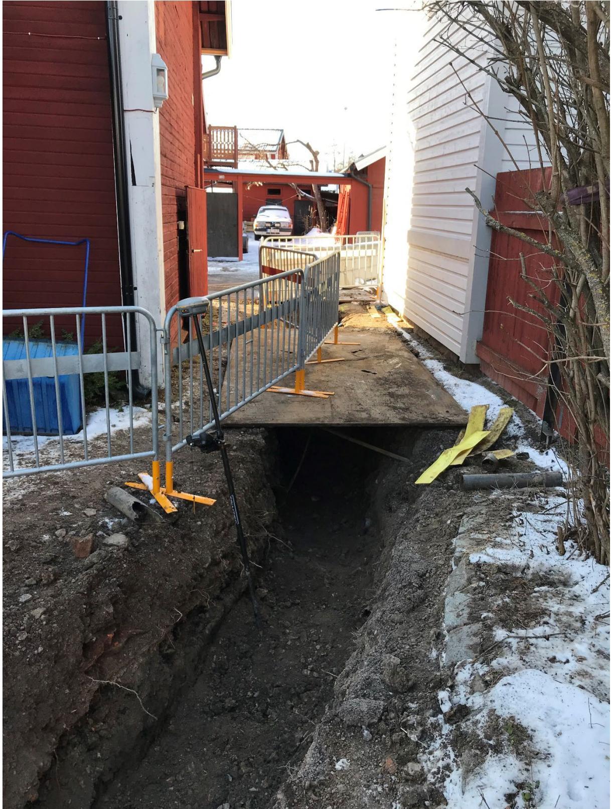
Foto 4. Översikt av del av schaktet inne på gården ut mot Åsgatan. Från ostnordost.