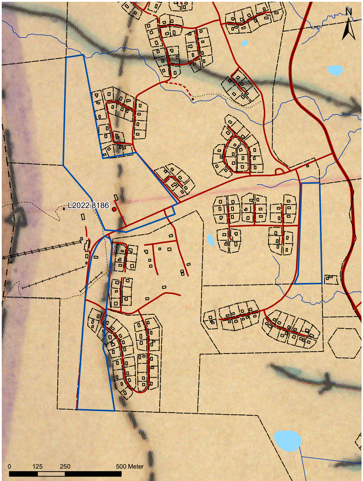
Figur 3. Utsnitt från karta över Särna och Idre socknar från 1919 (20-säa-203) rektifierad mot fastighetskartan med stigen som en streckad linje, utredningsområdena markerade med blå linjer och rösningen L2022:8186 med en röd punkt. Skala 1:10 000.