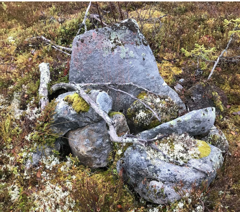
Foto 2. Rösningen L2022:8186 fotograferad från norr.