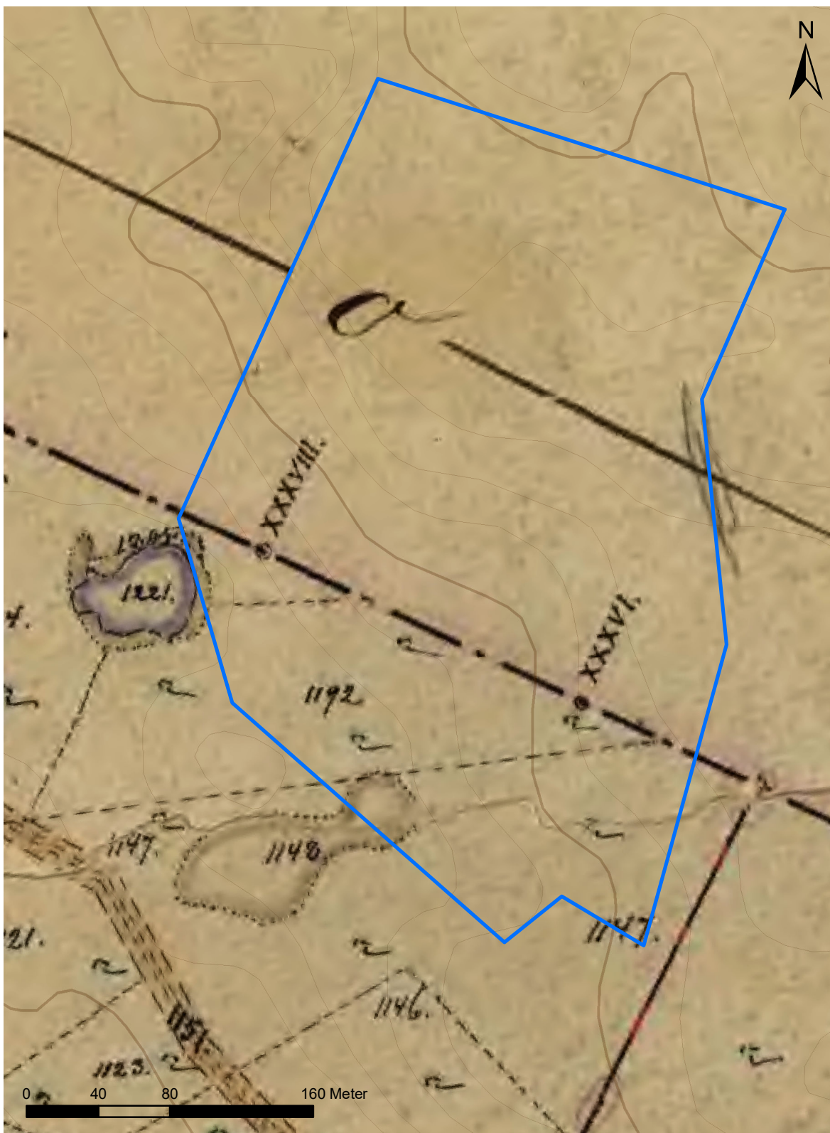
Figur 3. Utsnitt från storskiftetskartan (20-säa-64.5) med de två gränsmärkena XXXVIII och XXXVI. Utredningsområdet markerat med blå linje. Skala 1:3000.