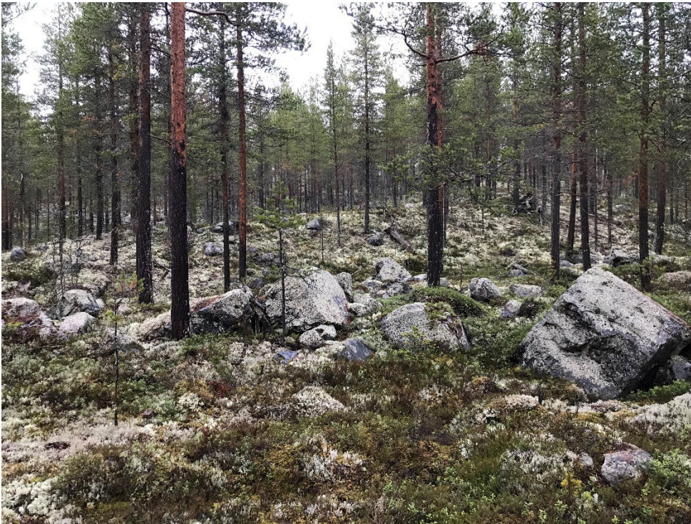
Foto 1. Terrängen i den nordvästra delen av utredningsområdet.