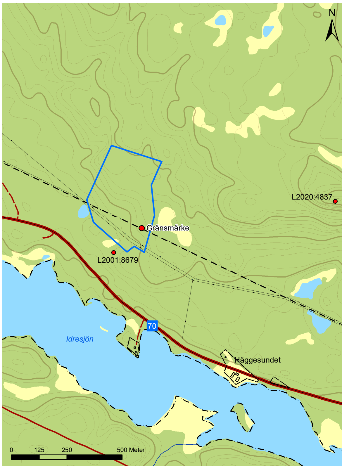
Figur 2. Utsnitt från fastighetskartan med utredningsområdet markerat med blå linje, gränsmärket och två av de omnämnda registrerade lämningarna med röd punkt. Skala 1:10 000.