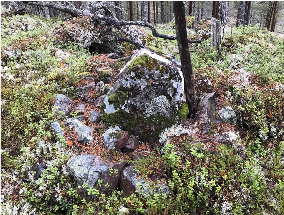
Foto 2. Gränsmärket fotograferat från norr.