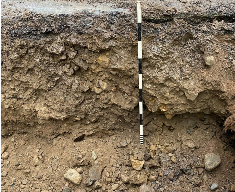
Foto 3. Nordvästra schaktväggen i schakt 4. Överst homogen slagg och i botten rundade stenar i sand.