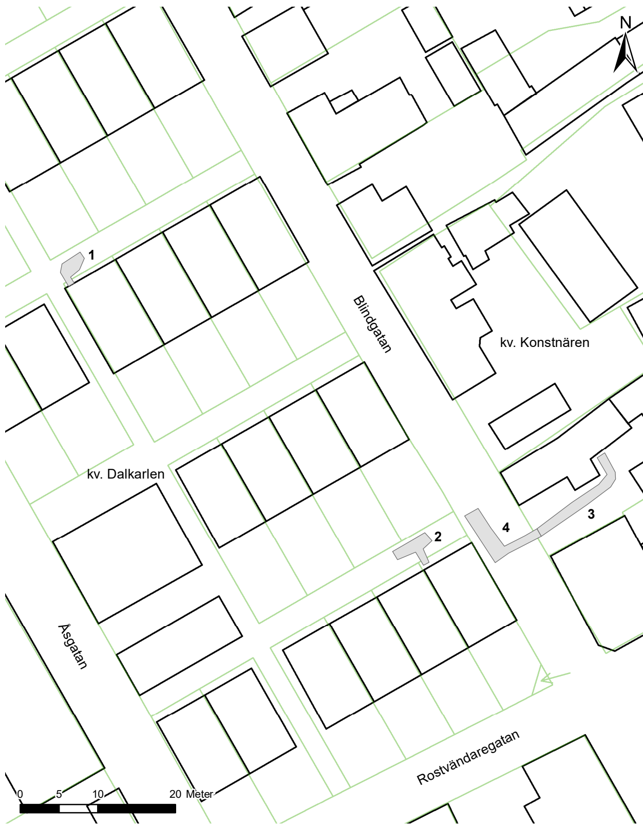
Figur 3. Planritning med schakten i grått och respektive nummer. Skala 1:500.