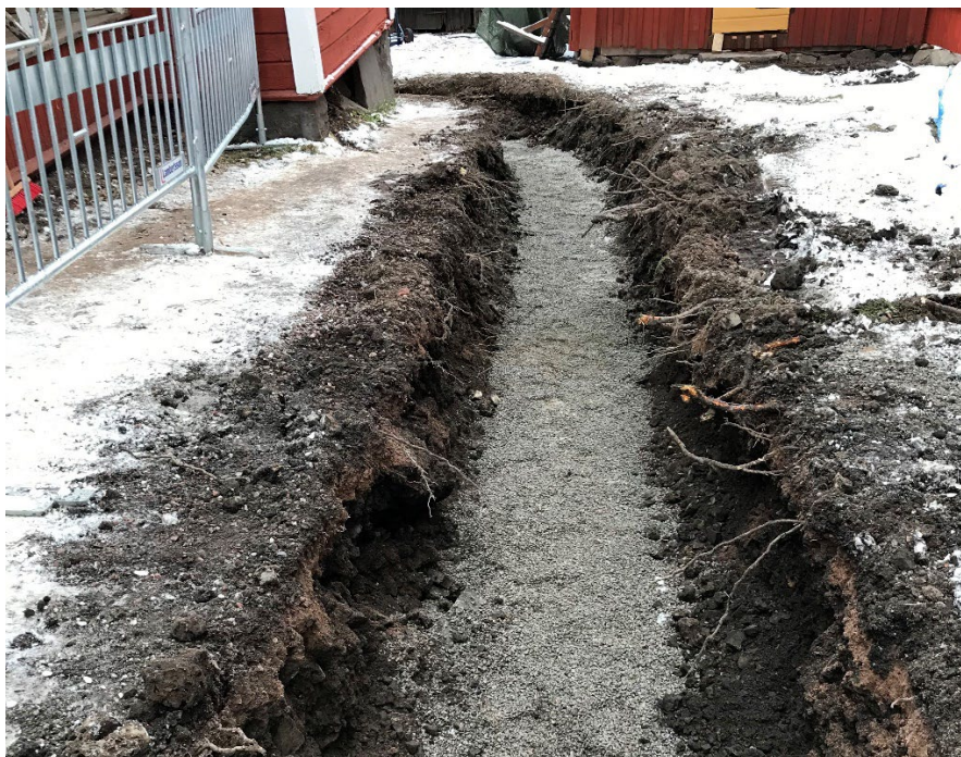
Foto 1. Översikt schakt 3 från sydväst efter att botten hade fyllts med grus.