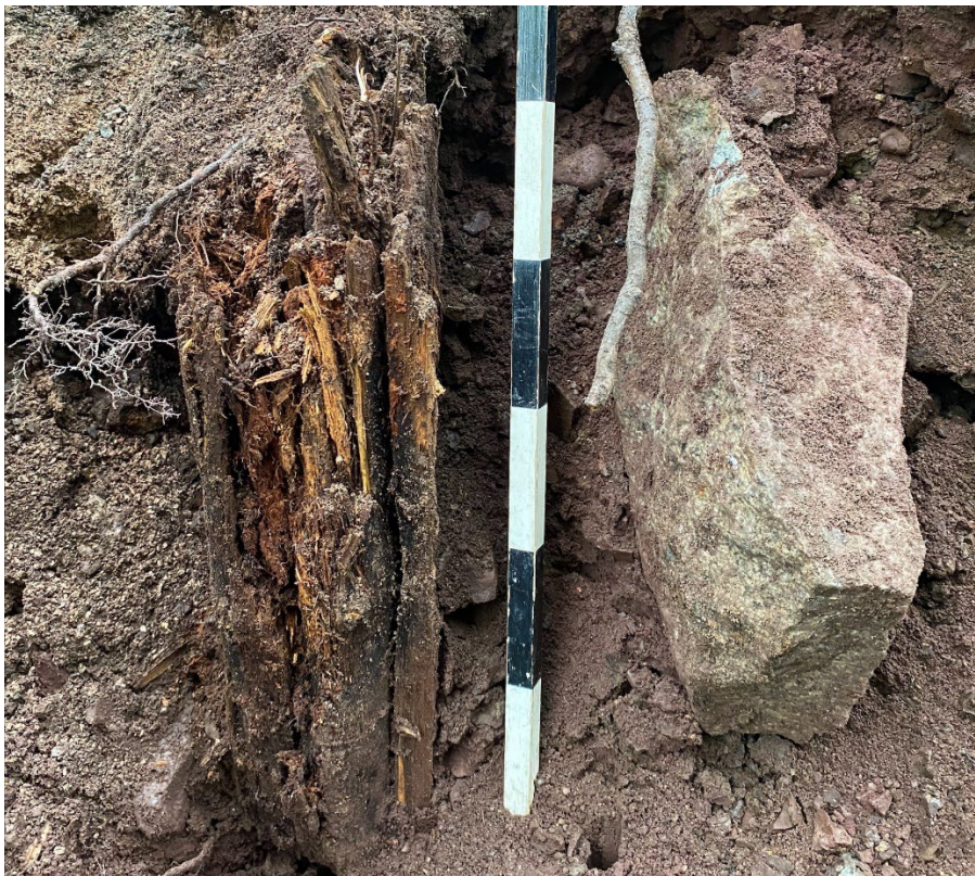
Foto 4. Resterna efter en stolpe i schakt 4.