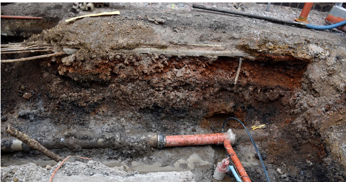
Figur 2: Översikt från SV.