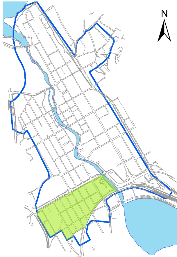
Figur 2: Falu stadslagers (L2001:4288) utbredning samt stadsdelen Elsborg markerat (t.h.), plan över kvarteren i Östansfors med schaktets placering markerat (nedan).