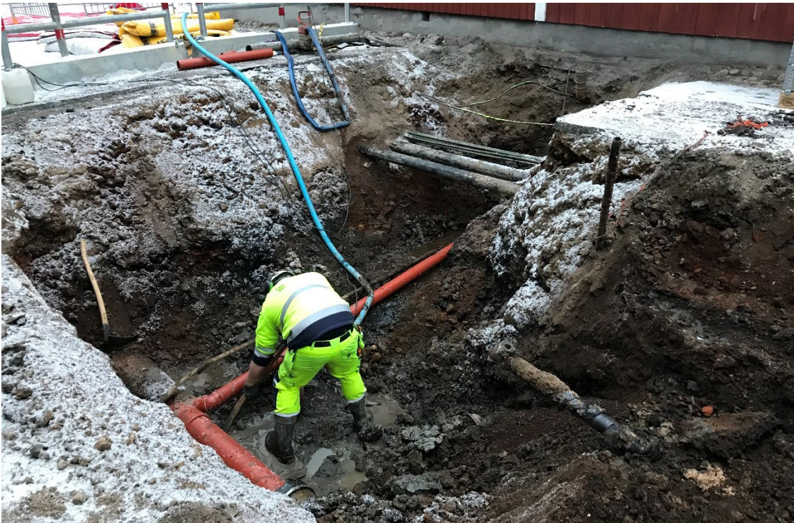
Figur 1: Översikt från N.