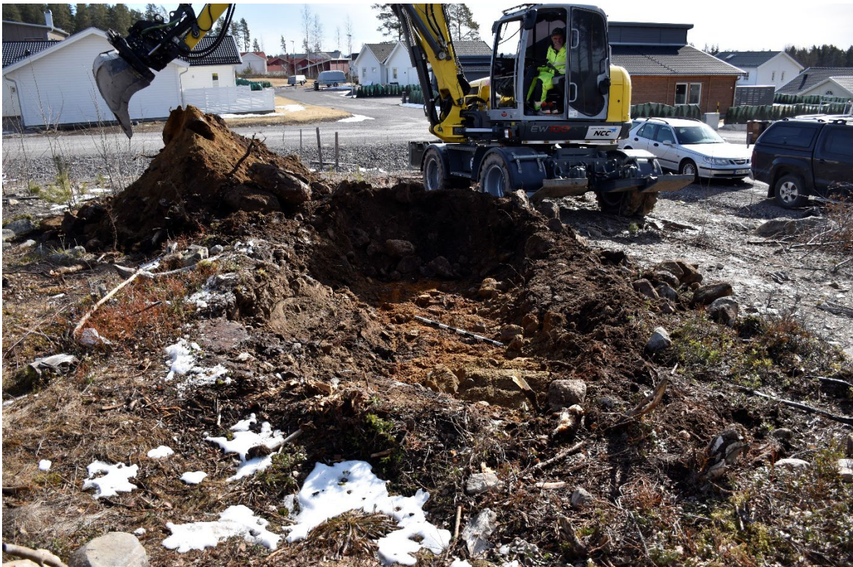
Figur 4.2. Lämningen bortschaktad. I botten syns den naturliga moränen. Från V.