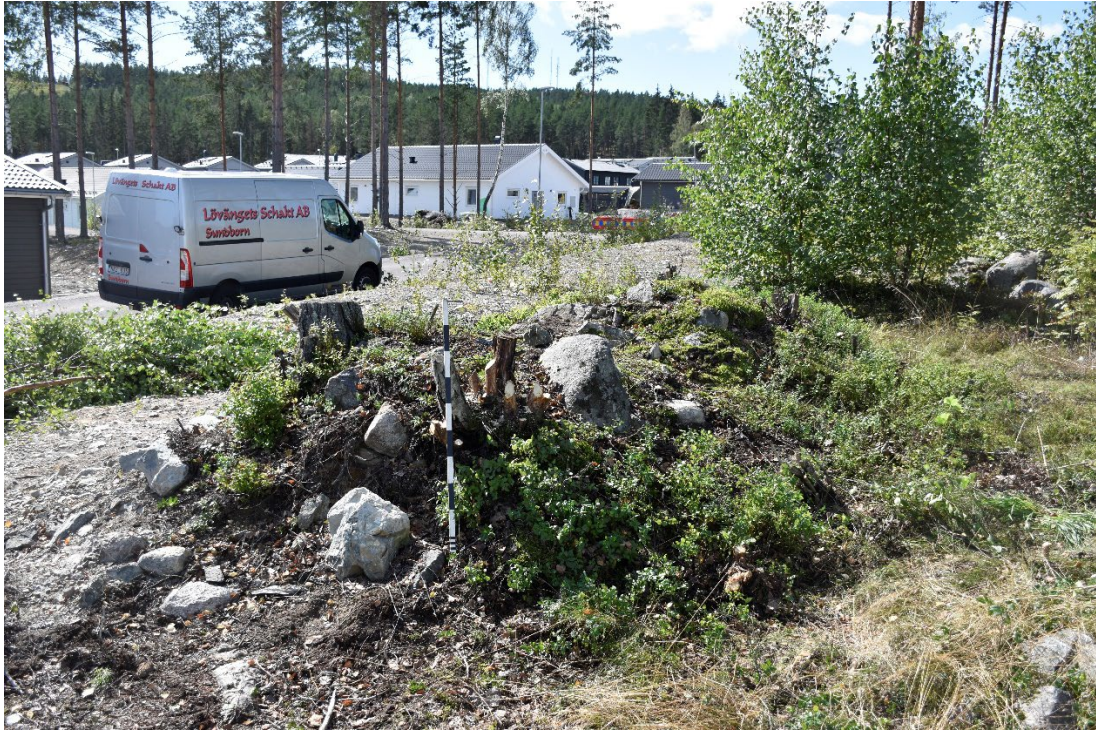
Figur 1.2. Lämningen efter att den rensats på sly och mindre träd. Från NNV.