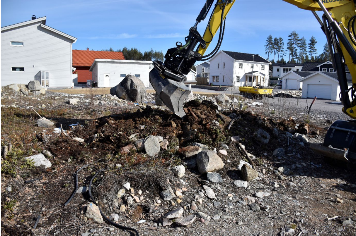
Figur 3.2. Lämningen schaktas bort. På bilden kan man se att stenmaterialet är uppblandat med jord. Från SV.