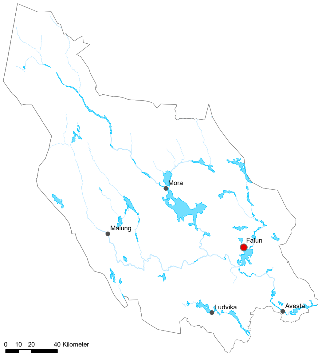
Figur 1.1. Karta över Dalarna, Falun markerat med en röd prick.