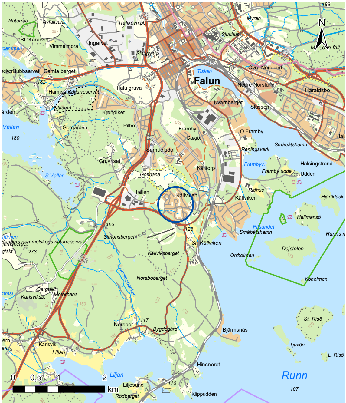
Figur 2.1. Utdrag ur terrängkartan med undersökningsområdet markerat med en blå cirkel. Skala 1:50 000.