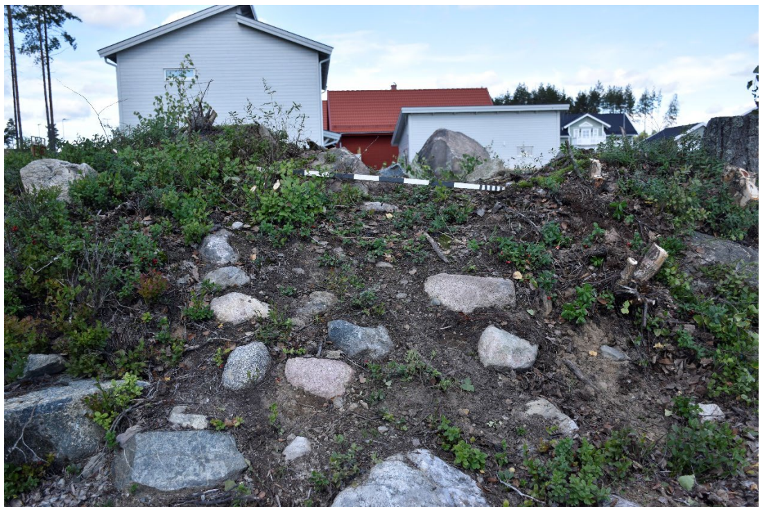
Figur 2.2. "Skogsstig" över lämningen. Från S.