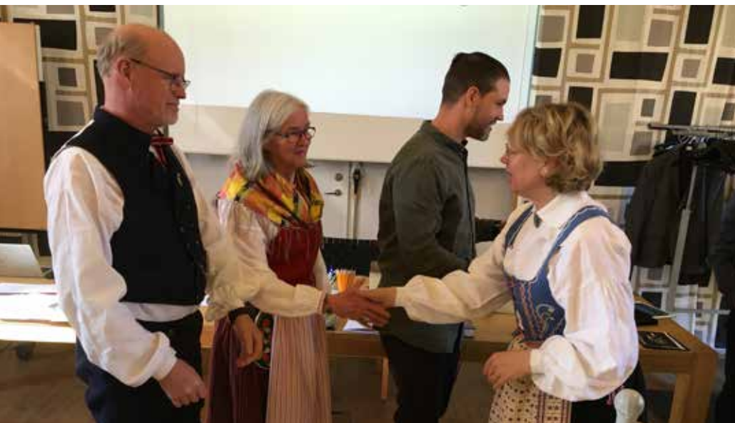
Föreningen Ulum Dalska gratuleras av landshövding Helena Höij för utmärkelsen årets hembygdsförening.