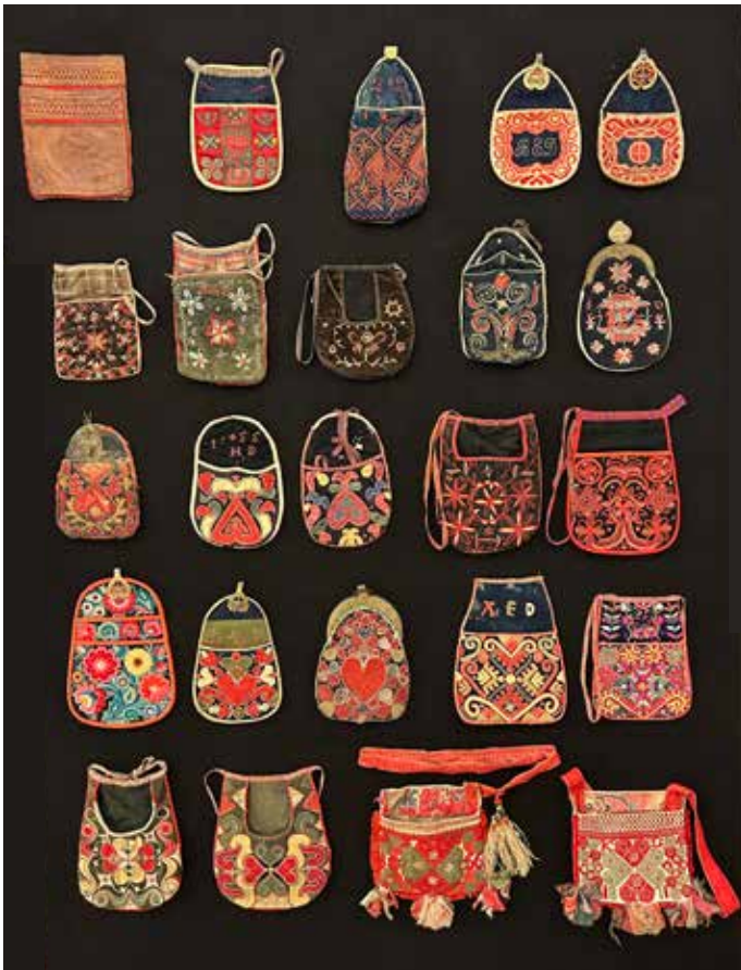
Väggen med kjolsäckar i utställningen "Klädd i Dalarna".