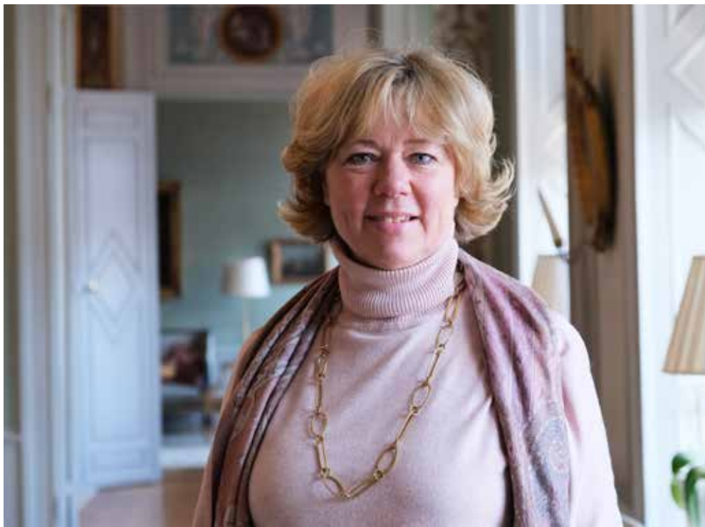
Helena Höij, landshövding Dalarna.