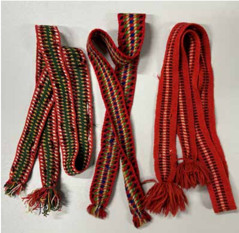
Ovan: Språngande strumpeband "Pinnband" i Dalarnas museums samlingar. Nedan: Språngade strumpeband från Svärdsjö.