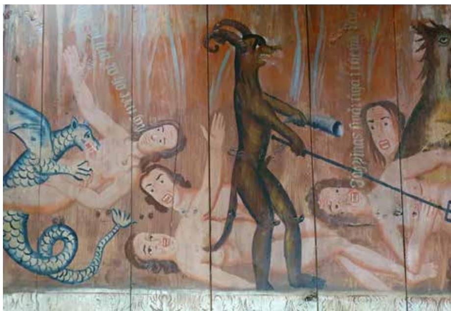
Djävulen som han porträtteras på dalmåningar.

Ska man spekulera lite skulle anledningen till att Lucia ska vara blond vara just därför att seden började firas på det sätt som vi känner till för hundra år sedan och kan ha lite med den tidens forskningsfält rasbiologi. Det första luciatåget som firades i Sverige var en skönhetsävling, vilket ju när man tänker efter inte riktigt matchar den riktiga Lucia. Vårt lilla helgon från Syrakusa ska enligt en legen har stuckit ut sina strålande vackra ögon för att inte vilja locka till sig män då hennes liv tillhörde Gud (förenklat uttryckt), vilket gör att när man tänker efter förefaller det ganska bisarrt att få henne med en skönhetsävling där kvinnor uppmärksammas för det som