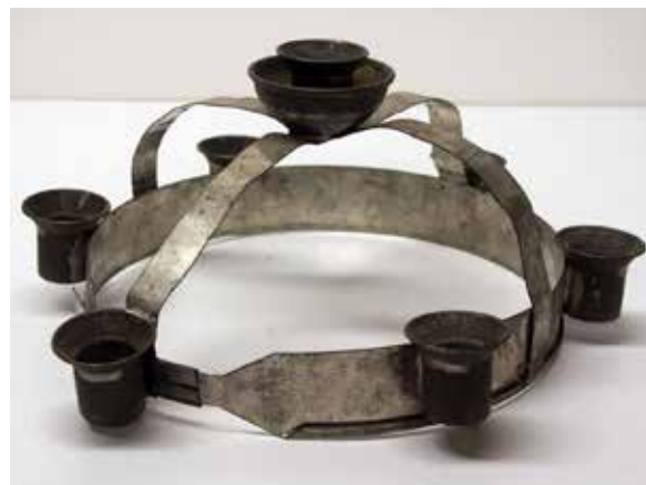
Luciakrona av plåt. DFK 0255-127.

HEMBYGDSRÖRELSEN ARBETAR MED traditioner; vi bevarar och uppmärksammar vår historia från ett lokalt perspektiv och presenterar en mikrohistoria. I dag är dessutom traditioner i ropet; det gamla har blivit trendigt eftersom det anses vara "äkta". Vi har år 2023 ungefär samma syn på äldre tiders företeelser som nationalromantikerna vid förra sekelskiftet; vi söker oss till "autentiska" upplevelser, vi renoverar i "gammaldags" stil, och hyllar traditioner. Men frågan är vad som händer med traditioner som inte tillåts utvecklas.