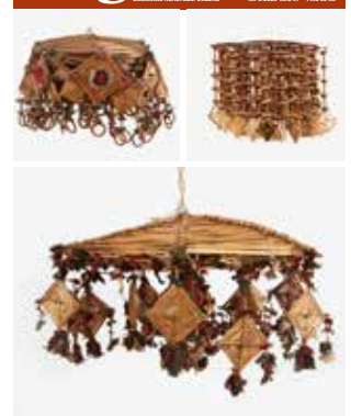
Halmkronor från museets samling.