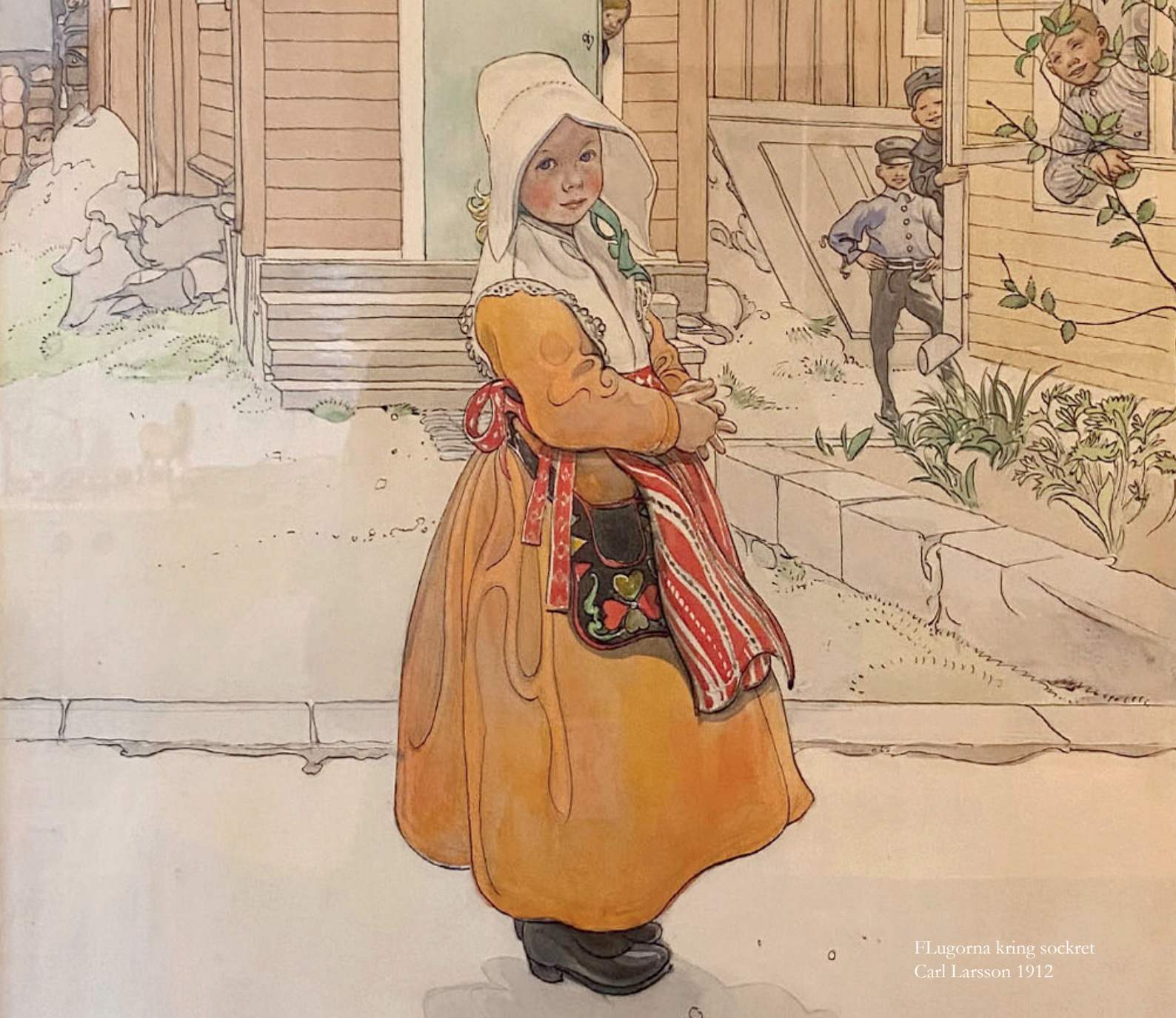
Flugorna kring sockret Carl Larsson 1912