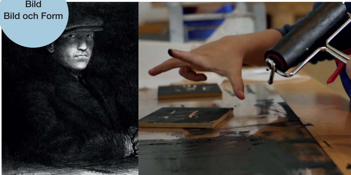
Bild Bild och Form